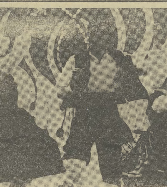
PO ZAKOPIAŃSKIM ŚWIĘCIE GÓR