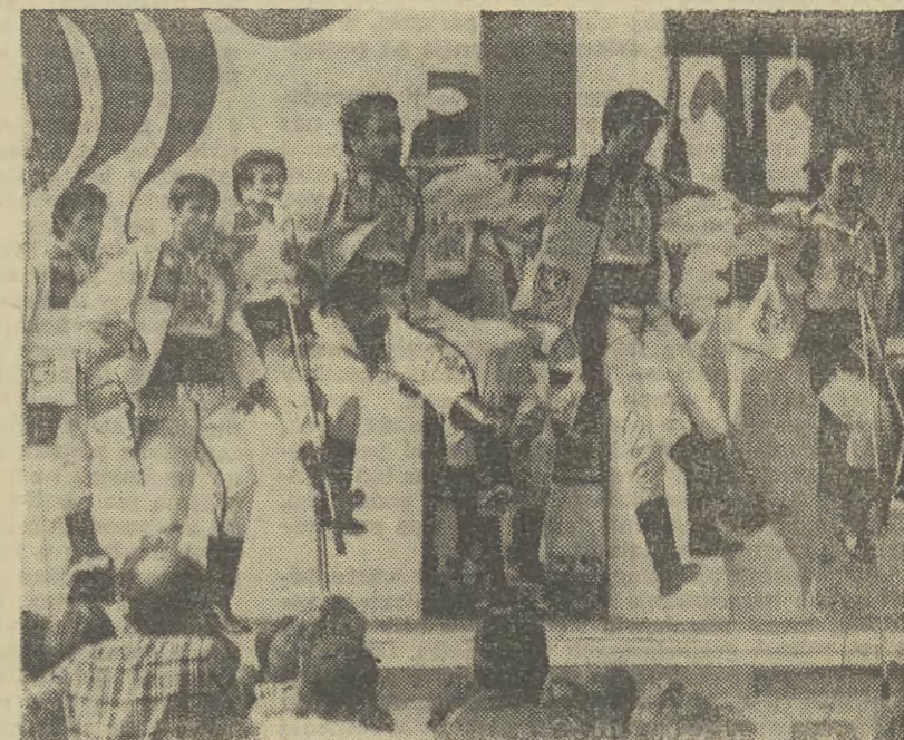
Europejskich górali fotografował pod Giewontem