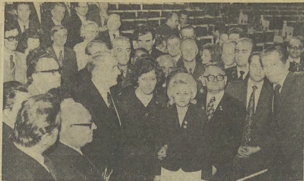
Edward Gierek i Henryk Jabłoński, wśród delegatów.