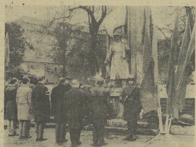
Uroczystość składania wieńców na grobach żołnierzy radzieckich koło Barbakanu.

(Inf. wł.) Choć już pewien czas od ustawienia „Ognistych ptaków” na skarpie pod Zamkiem Książą Pomorskich upłynął, jeszcze nie oglądaliśmy ich na lamach naszej gazety. Budowane w czerwcu przy pomocy pracowników Zakładów Mechanicznych Stoczni Szczecińskiej im. Adolfa Warskiego, całe z ocynekowanej blachy, 6 lipca pomknęły pierwszy raz w blasku ognia i kłębach dymu w dół po skarpie. „Pomknęły” — oczywiście w przenośni, bo tylko kształt ich sugeruje pęd, one same stoją nieruchomo. A co o „Ognistych ptakach” mówił ich twórca, Władysław Hasiór? — „Ptaki to generalna próba przed sporządzeniem pomnika tego typu. One same pomnikiem nie są — rezygnacja z monumentalnej formy polega tu przede wszystkim na odejściu od dramatycznego nastroju, tragicznej ekspresji na rzecz pogody i wy- mowy dekoracyjnej”. (ban)