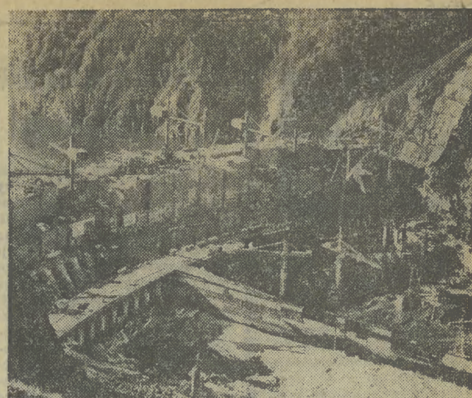
Dobiegają już końca prace przy uruchomieniu pierwszego turbosprężarki elektrowni Sajano-Szuszewskiej na Jeniseju. Będzie to największa na świecie elektrownia wodna o mocy 6400 MW. N/z: ogólny widok budowy.

PIĄTEK, 29. XII. 1978 R. ◆ NR 295 (9518) ROK XXX ◆ CENA 1 ZŁ ◆ WYD. A