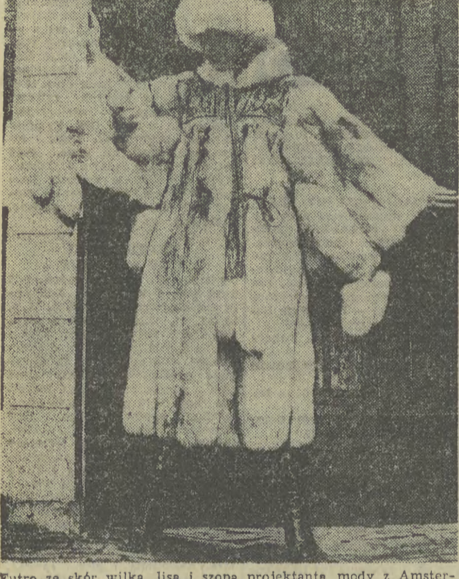
Futro ze skór wilka, lisa i szopa projektanta mody z Amsterdamu.

czynne będą objazdy drogi tranzytowej. Ministerstwo Komunikacji i Łączności WRP gorąco zaleca, aby pojazdy ciężarowe, które przejeżdżają przez węgierską granicę przez Sopron, Hegyeshalom, Rajka lub Komarom nie udające się bezpośrednio do rejonu Budapesztu, jak również te pojazdy, które zamierzają opuścić Węgry w tranzycie przez przejścia graniczne Tompa, Roeszke, Nagylak lub Gyula, korzystają z mostu Donaubrücke — Dunaföldvár. Objazdy są zaznaczone odpowiednimi znakami drogowymi.