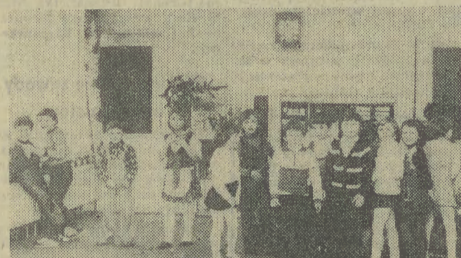
Dzieci w nowym przedszkolu „Vistuli”.