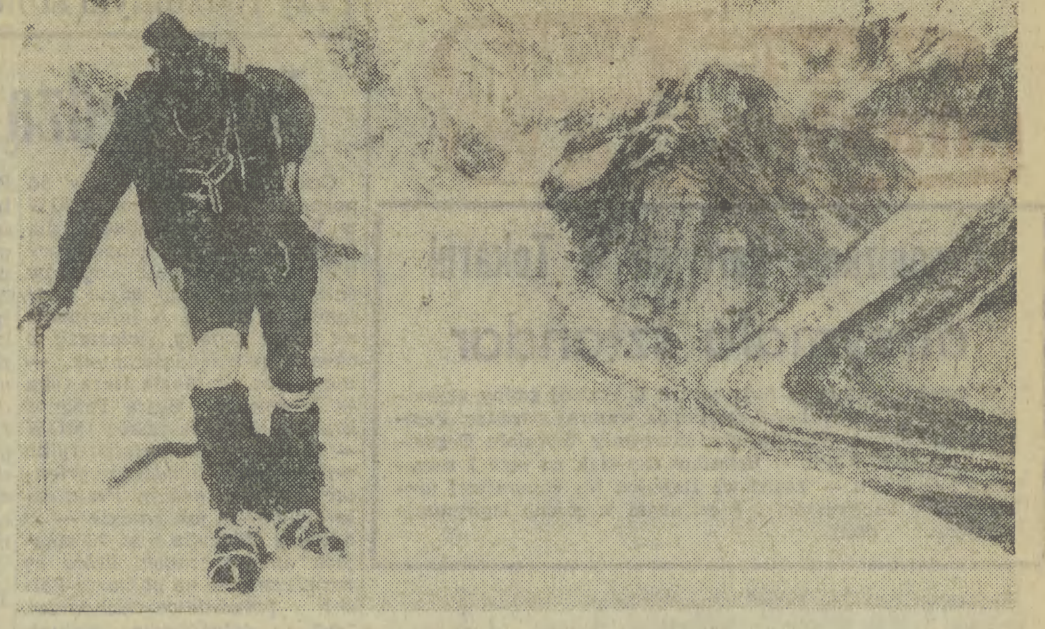
TADZYCKA SR: W górach Pamiru w pobliżu granicy z Chinami i Afganistanem. Stąd rozchodzą się promienie potężne fałszywych górskie Hinduksu, Karakorum i Kunlunu. Najwyższy szczyt — Pik Komunizmu — 7495 m.

Proszę Wysocką Izbę o uchwalenie ustawy budżetowej i o przyjęcie uchwały o Narodowym Planie Społeczno-Gospodarczym na rok 1979.