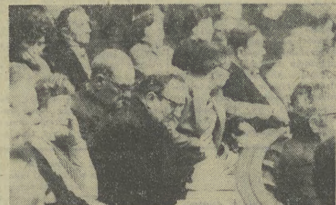
Posiedzenie Sejmu. N/z: ławy poselskie.