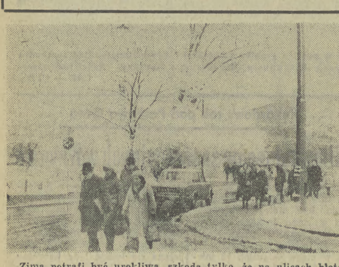
Zima potrafi być urokliwa, szkoda tylko, że na ulicach błoto.