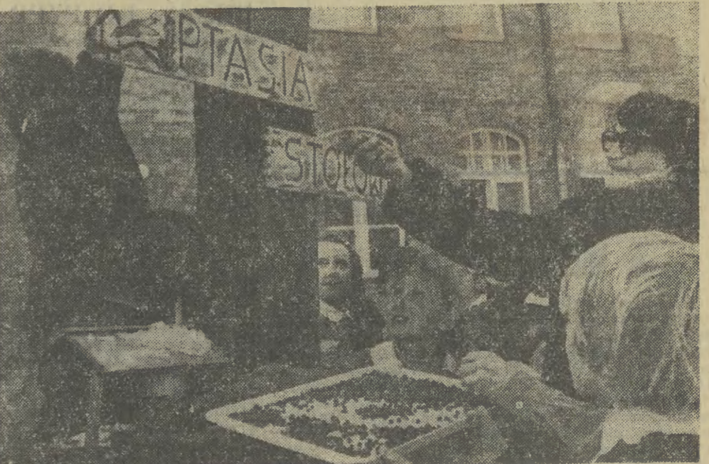
Dzieci ze Szkoły Podstawowej w Stawigudzie (woj. olsztyński) pomyślały już o swoich ulubionych...

Jestem przekonany, że pracy naszej jak i zawsze nadal towarzyszyć będą wzajemna pomoc i życzliwość. Wspólnie mobilizując wszystkie nasze siły, jednocząc naród wokół nadrzędnego celu, jakim jest dobro socjalistycznej ojczyzny sprostały zadaniami na rok przyszły i lata następne. Życzmy sobie nawzajem Drodzy Towarzysze, aby owoc naszego trudu coraz lepiej służył narodowi.