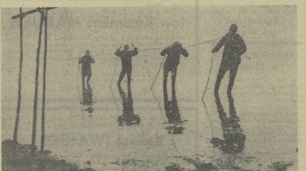
CSRS. Rybacy z największego w południowych Czechach gospodarstwa rybnego w Rožemberku. Na święteczne stoly w kraju i za granicą trafią stąd 230 ton ryb głównie karpia.

energetyk Franciszek Gruska twierdzi, że wszystkie zbędne urządzenia są wyłączane. Aparatura wielostanowiskowa działa jedynie przy pełnej obsadzie, oświetlenie zewnętrzne kierowa-