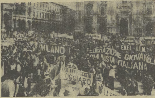
Podobnie jak w Polsce — w wielu krajach Europy odbyły się protestacyjne wiece w związku z rozstrzelaniem 5 hiszpańskich patriotów. Na zdjęciu: demonstracja w Mediolanie.

(INF. WL.) Śmierć pięciu antyfaszystów hiszpańskich, rozstrzelanych z rozkazu reżimu frankistowskiego, wywołała falę protestu na całym świecie. Świat podnosi w górę zaciętą pięść i woła przeciw faszyzmu Hiszpanii i Chile oraz silom reakcyjnym Portugalii — „No pasaran!“ Nie mogą przejść faszyści przez trupy poległych bohaterów w Hiszpanii do wzmożenia swej władzy. Na hańbę wydają się żołdacy reakcyjni w Chile. Potępienie wywołują siły prawicy, które chcą rozbić osiągnięcia ruchu rewolucyjnego w Portugalii. Zebrała protestacyjnie odbywają się również w całej Polsce.