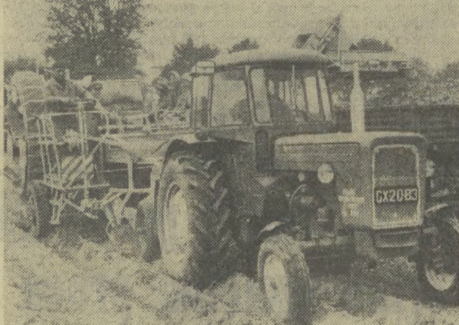
Wykopki ziemniaków przy pomocy kombajnu — w Stacji Hodowli Roslin Celbowo w woj. gdańskim.

Na zaproszenie Prezydium Sejmu PRL przybyła wczoraj do Polski z kilkudniową wizytą oficjalną delegacja parlamentu Republiki Indii. Na czele delegacji stoi przewodniczący Izby Ludowej parlamentu, członek partii Indyjski Kongres Narodowy — Gurdial Singh Dhillon. Na warszawskim lotnisku gości powitali: marszałek Sejmu Stanisław Guewa, przewodniczący sejmowej komisji spraw zagranicznych pos. Wincenty Kraśko, przedstawiciele MSZ, grupa posłów. W pierwszym dniu wizyty delegacja parlamentu indyjskiego przyjął marszałek Sejmu. Spotkanie poświęcone było omówieniu stosunków polsko-indyjskich i współpracy parlamentarnej między naszymi krajami.