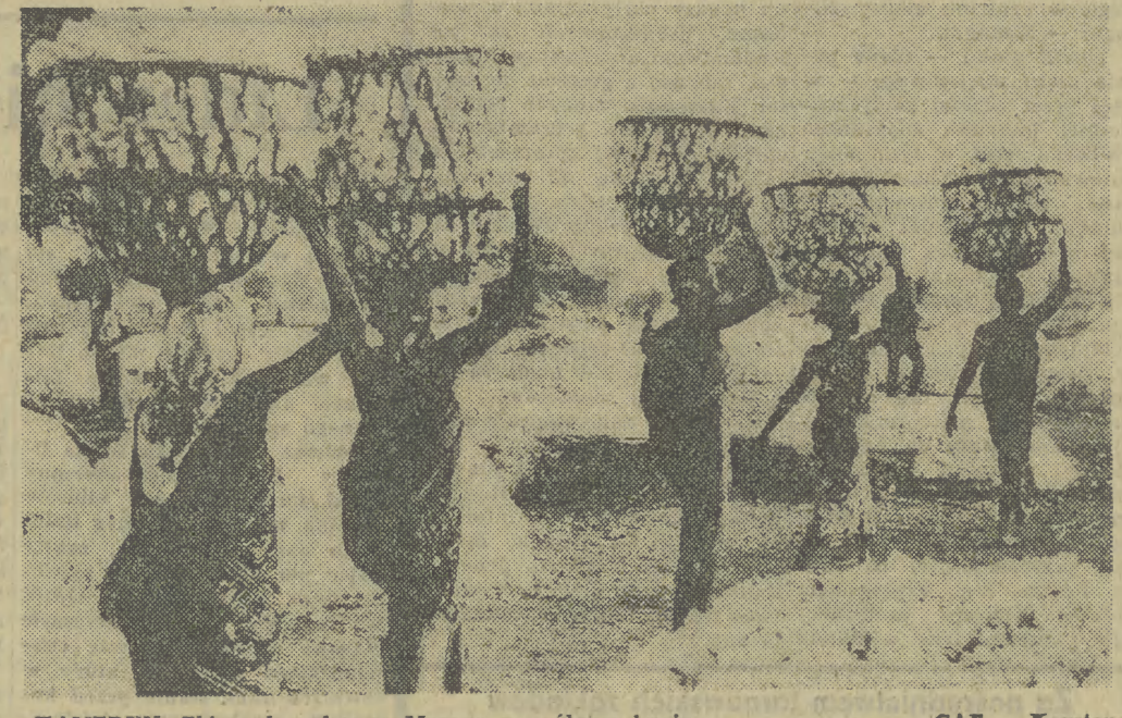
KAMERUN. Zbiory bawełny w Maroua na północy kraju.