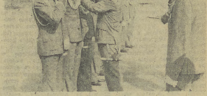
Uroczystość nadania odznak I, II i III klasy pilotom i nawigatorom.

Premier odwiedził szereg obiektów w Olsztynie, m. in. zbudowany przy pomocy żołnierzy nowego mostu na rzece Lynie, stadion Klubu Sportowego „Stomil”, który będzie miejscem głównych uroczystości Święta Pionierów, oraz tereny przyszłej wystawy hodowlanej w Żalbach k. Olsztyna. Premier wy-