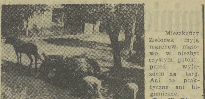
Mieszkańcy Zielonek myją marchew masowo w niezbyt czystym potoku, przed wyjazdem na targ. Ani to praktyczne ani higieniczne.