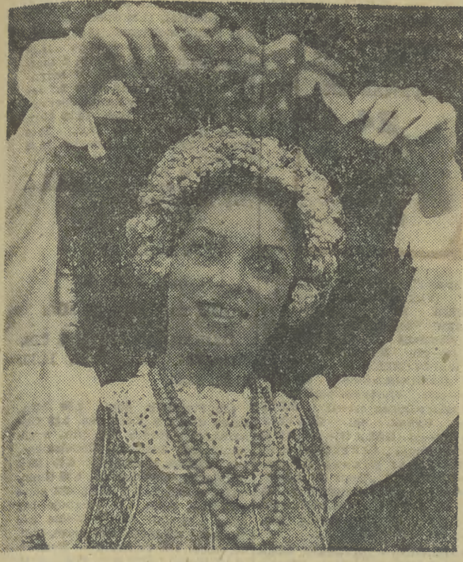
Dziewczęta z „Matowszka” słyną z urody i wdzięku, co widać na naszym zdjęciu.