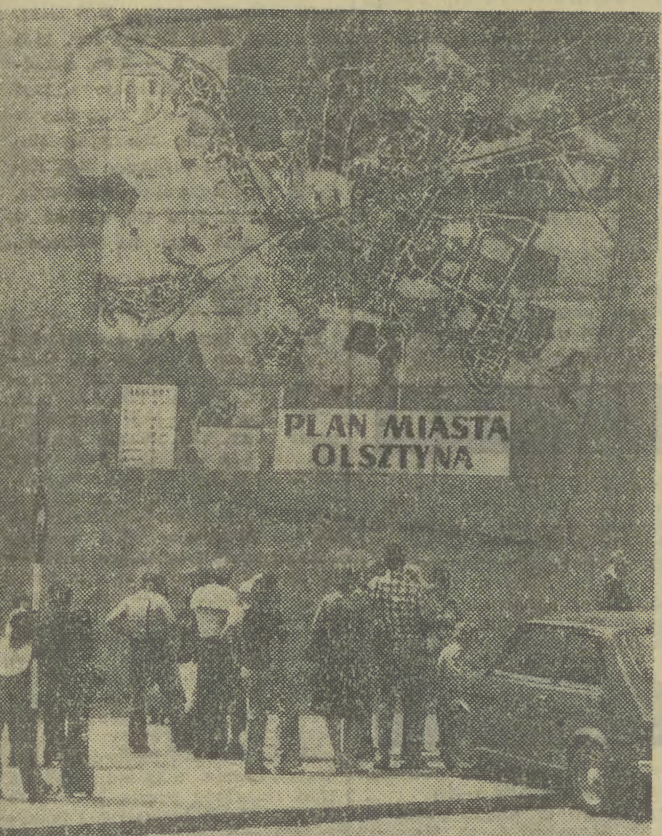
PLAN MIASTA OLSZTYNA

Według przewidywań Ministerstwa przyspieszone prace wydobywcze, prowadzone wzdłuż rzek tego regionu mogą przyczynić się do poprawy sytuacji gospodarczej kraju. Do Ministerstwa napłynęło już 500 podań o udzielenie zezwolenia na otwarcie kopalni.