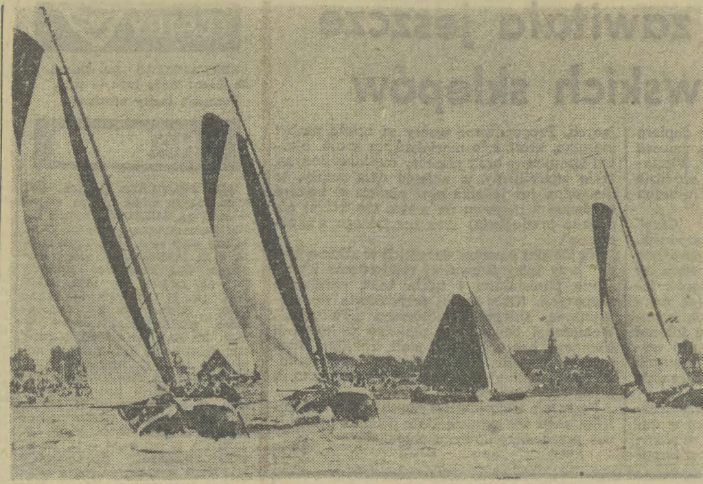
HOLANDIA. Doroczne pokazy zabytkowych łodzi żaglowych, które jeszcze 50 lat temu regularnie pływały po holenderskich jeziorach i kanałach.

Podkreślając postęp osiągnięty w dotychczasowych rokowaniach, rzecznicy wskazali zarazem, że temat negocjacji wiąże się z jedną z głównych gałęzi gospodarki wielu krajów, jaką jest przemysł chemiczny.