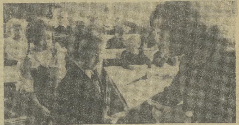
Moment wręczania tarcz z numerem szkoły pierwszoklasistom dziesięćlatkami przez wychowawczynię klasy.

(INF. WL.) Nowe programy, nowe sposoby nauki, nowe perspektywy — to wszystko czeka tegorocznych pierwszoklasistów. Oni sami na ogół nie zdają sobie sprawy z roli jaką przypadła im w udziale — awangardzie dziesięćlatkami. Za to rodzice wyjątkowo interesują się i przejmują losami swych pociech, czasami aż nadmiernie. Uważając jednak, iż lepsze zainteresowanie nadmierne niż słabe, w szkołach z radością witano dzisiaj rodziców przybyłych z najmłodszymi uczniami. Większość zaproszona do razu na spotkanie z nauczycielami czy dyrektorami szkół, na których omawiano program klas pierwszych, wyjaśniano wątpliwości i obawy rodzicielskie.