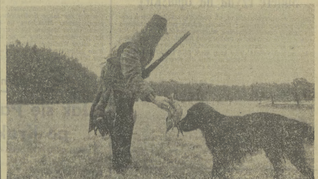
JAK WIDAC, RĘKA, OKO I... PIES NIE ZAWODZĄ.