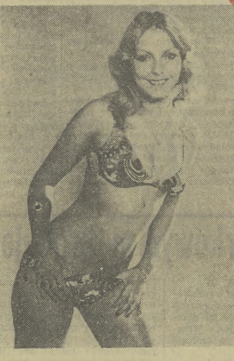
Czy bikini przyda się jeszcze w tym roku?