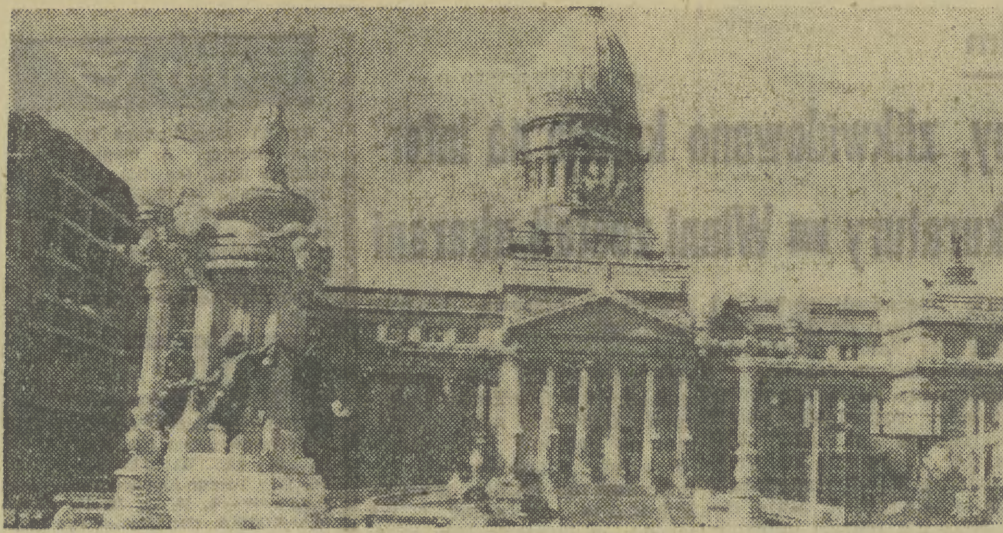
Argentyna. Budynek Kongresu Narodowego tzw. Kapitolu w Buenos Aires.

Minister Wojtaszek zaprosił ministra Louisa de Guiringaud do złożenia oficjalnej wizyty w Polsce. Zaproszenie zostało przyjęte z zadowoleniem.