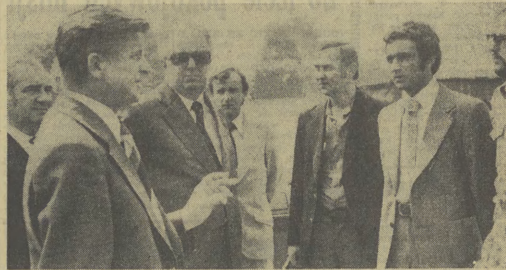
Stefan Olszowski i Kazimierz Barcikowski na Osiedlu Domów Jednorodzinnych.

(Inf. wł.). Wczoraj przebywał w Krakowie członek Biura Politycznego KC, sekretarz KC PZPR Stefan Olszowski. Jego wizyta miała charakter roboczy i poświęcona była podstawowym problemom budownictwa mieszkaniowego w naszym mieście.