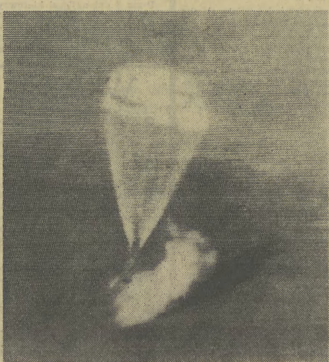
Moment lądowania kosmonautów.

Aparat lądujący statku „Sojuz-30” dokonał łagodnego lądowania w przewidzianym rejonie terytorium Związku Radzieckiego w odległości 300 km na zachód od miasta Celinograd. Samopoczucie kosmonautów Klimuka i Hermaszewskiego po wylądowaniu jest dobre.