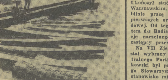
Stare Jabłonki koło Ostródy są znanymi i lubianym miejscem wypoczynku.

Od chwili zamknięcia luku przejściowego, — kontrolę nad „Sojuzem 30” przejmują tak zwana mała sala centrum kie-