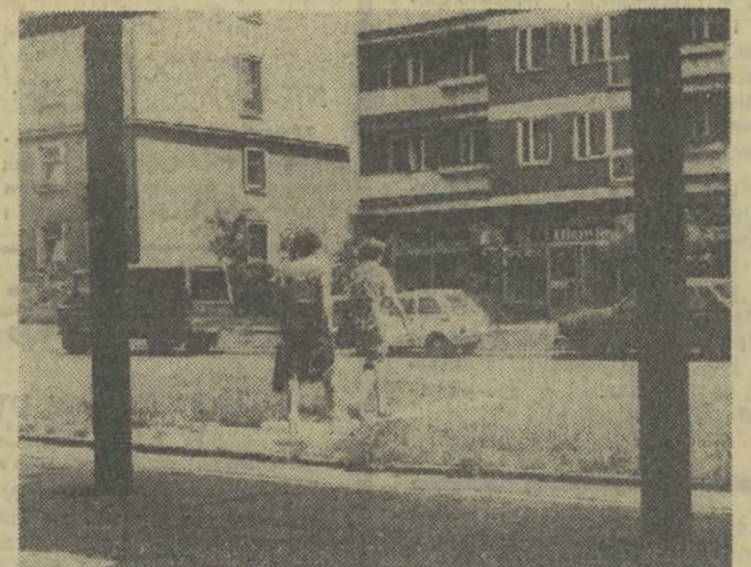
Pewnie, tak jest bliżej! A o taki drobny zieleńcy naprawić nie ma się, co kłócić. Czy rzeczywiście?