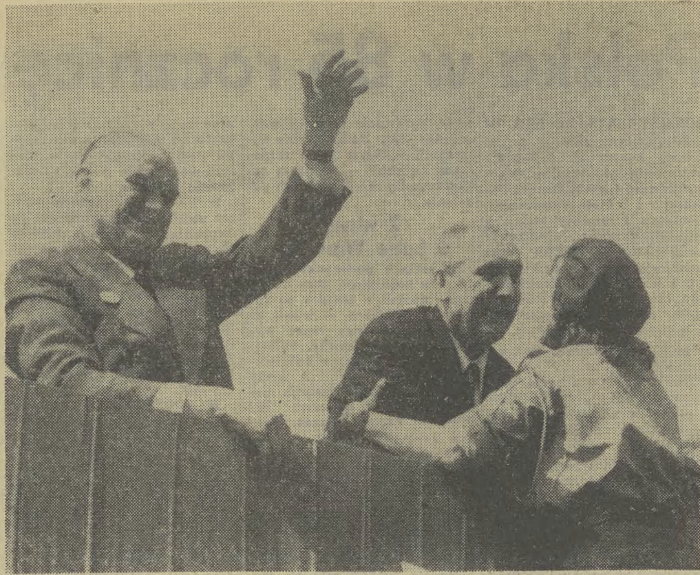
1 Maja w Warszawie. Trybuna honorowa.