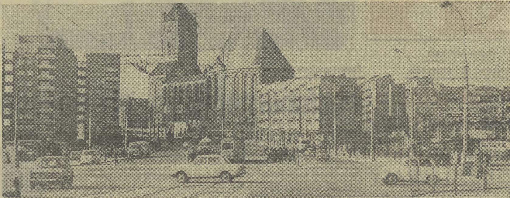
Panorama odbudowanego z ruin Starego Miasta w Szczecinie.

Organ Komitetu Wojewódzkiego Polskiej Zjednoczonej Partii Robotniczej