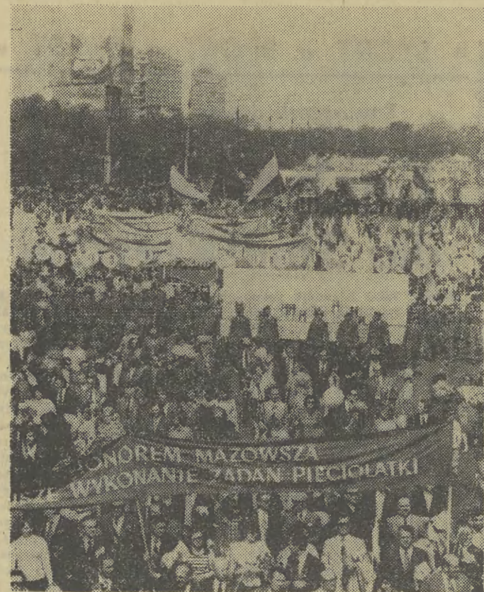
Mazowsze w defiladzie 1-majowej.

Roźbrzmiewają dźwięki „Warszawiaki”. Pierwsze szeregi (DOKOŃCZENIE NA STR. 2)