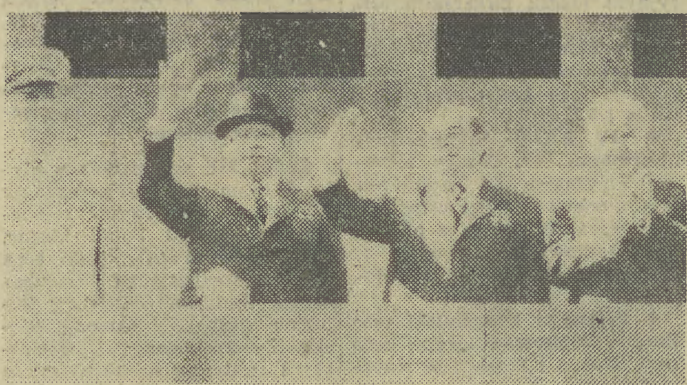
Uroczystości 1-majowe w Moskwie. N/z: na trybunie honorowej — od lewej — A. Greczko, N. Podgorny, L. Breźniew, A. Kosygin.