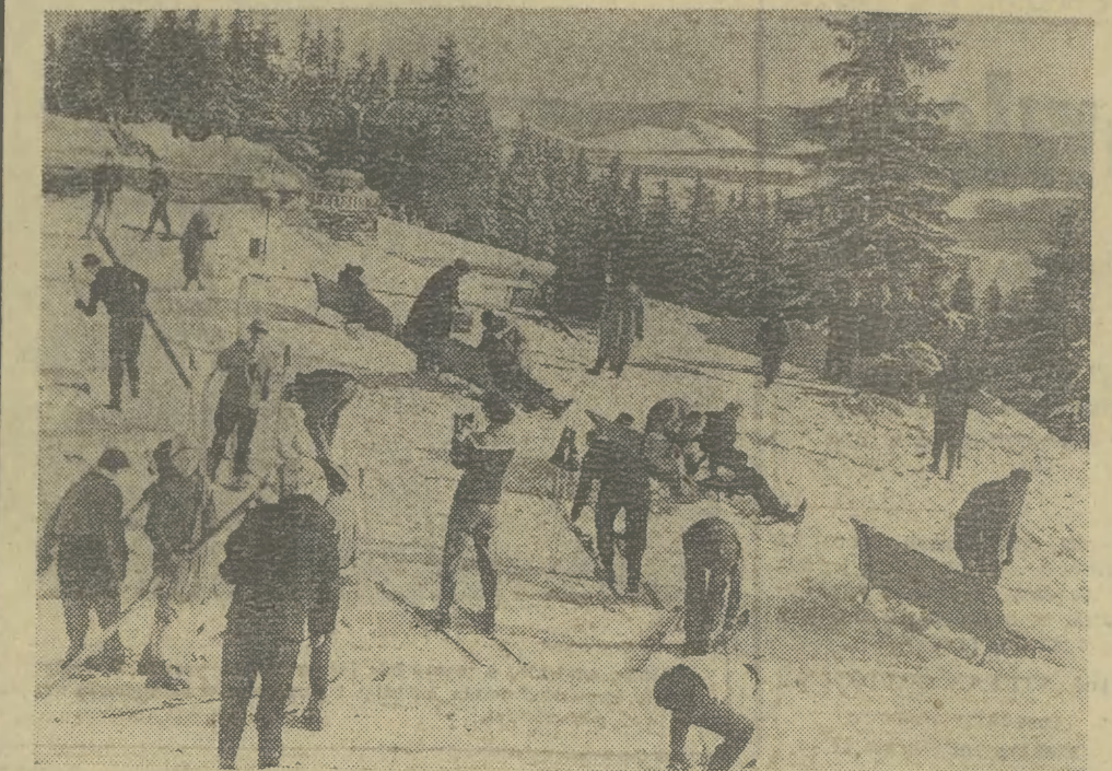
ZAKOPANE. Gubałówka — „raj narciarzy”. Udała się licytacja wczasowicem tegoroczna śloma w Tatrach.

Są to dobre doświadczenia. Z całą pewnością powinny być kontynuowane. Oczywiście, jako stałe formy pracy. Kiedy tak wielką wagę przykładamy do upowszechniania sztuki, tym bardziej z tego rodzaju inicjatyw. Bo ranga sztuki zależy od jej społecznej powszechności. A ranga kultury społecznej — od sztuki, jaka w społeczeństwie „żyje”.