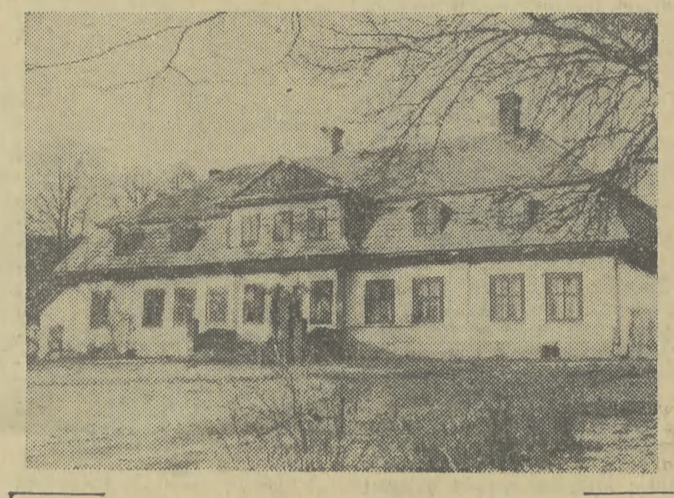
Zabytkowy dworek z poł. XVIII wieku w Raciechowiecach pod Myślenicami.