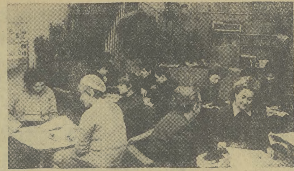
Kluby wiejskie, a mamy ich już w Polsce prawie 11 tysięcy, spełniają ważną rolę w dziedzinie upowszechnienia kultury. Na zdjęciu: w estetycznie urządzonej klubie we wsi Pogorzela (woj. poznański).

Na każdej stacji powiększa się ilość pasażerów pociągu podmiejskiego. Starsi grają w karty. Jak pociąg długi, słychać wtedy: ryńcie tego dupka królem, frajerze jeden... W innym kącie rozgrywa się licytacja: butka, żołędź, czerwien — traf. Pociąg stuka po szynach, jest coraz bliżej miasta. A w wagonach toczą się nieustannie te same gadki o „kumplach” i „kobiatach”. Między dorosłymi siedzą uczniowie różnych