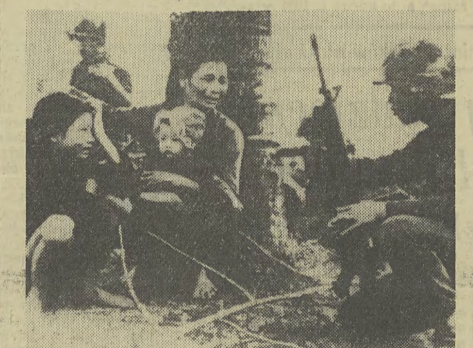
W jednej z okupowanych wiosek żołnierzy południowowietnamski przesłuchuje przerażoną Wietnamkę z małymi dziećmi.

W sobotę o godz. 1 czasu lokalnego zakończył się w Wietnamie południowym rozejm ogłoszony z okazji świąt przez Narodowy Front Wyzwolenia. Wojska amerykańskie i sągłoskie wznowiły działania bojowe w czwartek o godz. 1 czasu warszawskiego. Wbrew zapowiedzianemu przez dowódcę USA i wojsk reżimowych przerwanu ognia agresora spowodowały podczas okresu rozejmu kilka incydentów zbrojnych. Do starć doszło m. in.