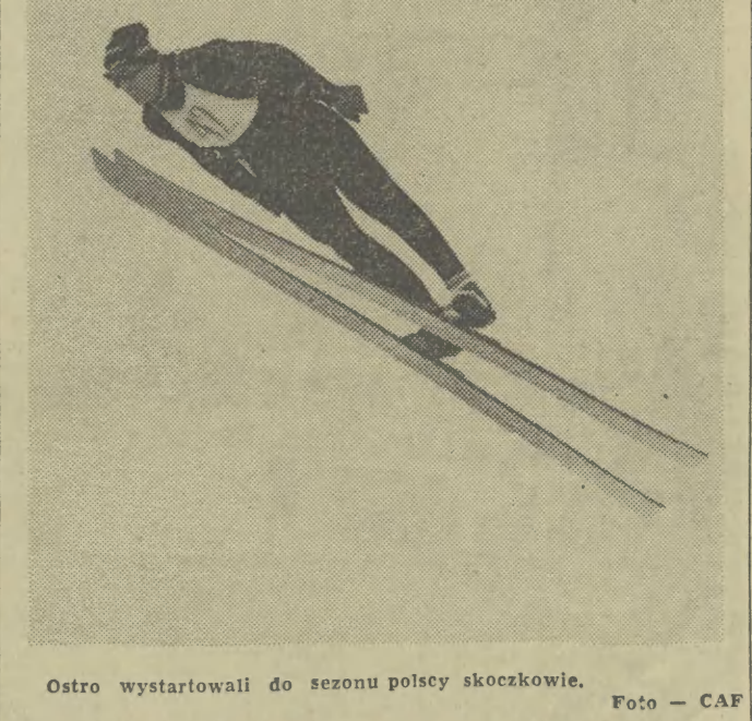
Ostro wystartowali do sezonu polscy skoczkowie.