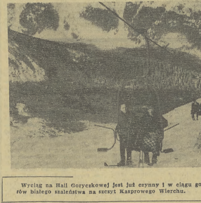
Wyciąg na Hal Goryczkowej jest już czynny i w ciągu godziny może przewieźć 720 amatorów białego szaleństwa na szczyt Kasprowego Wierchu.