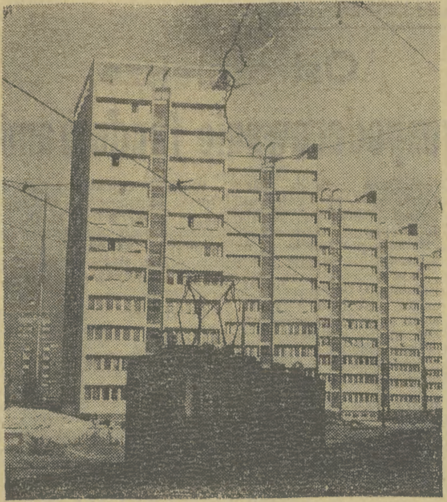
Dobiegają już końca prace przy budowie pięciu włośców przy ulicy Matejki w Szczecinie. Stanowią one wschodnią ielną część przyszłego centrum miasta.

W oparciu o prace dr C. Stypułkowskiego „Zagadnienia socjolekarskie młodzieży studenckiej” — Wyd. Krakowska Akademia Medyczna.