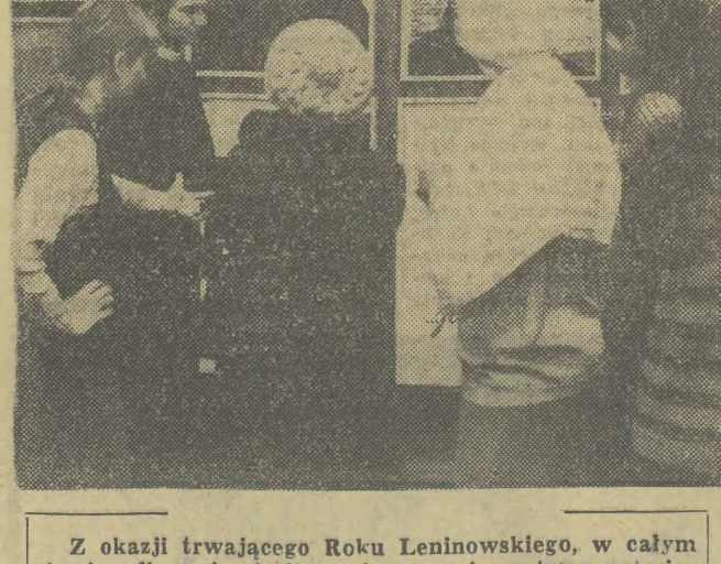
Z okazji trwającego Roku Leninowskiego, w całym kraju odbywają się liczne imprezy i wystawy poświęcone pamięci wodza światowego proletariatu. Na zdjęciu: fragment ekspozycji w Muzeum Lenina w Warszawie. CAF — fot. Rosiak

A TERAZ weźmy kilka najbardziej typowych przestępstw o charakterze chuligańskim. Jeden, dwóch czy kilku chuliganów niszczy nocą na Plantach ławki, skacząc na nie wzdłuż wyrywając oparcia, albo wybierają sobie oni jakąś inną ulicę i wybijają szyby, po kolei we wszystkich samochodach na niej stojących, lub wreszcie wpadają na pomysł, że na określonym odcinku Plant pobiją każdego, kto będzie nosił okulary — obojętnie, kobieta czy mężczyzna, a przy tym w pobliżu będzie pewien system — dwa razy uderzenie ręką i jedno kopnięcie.