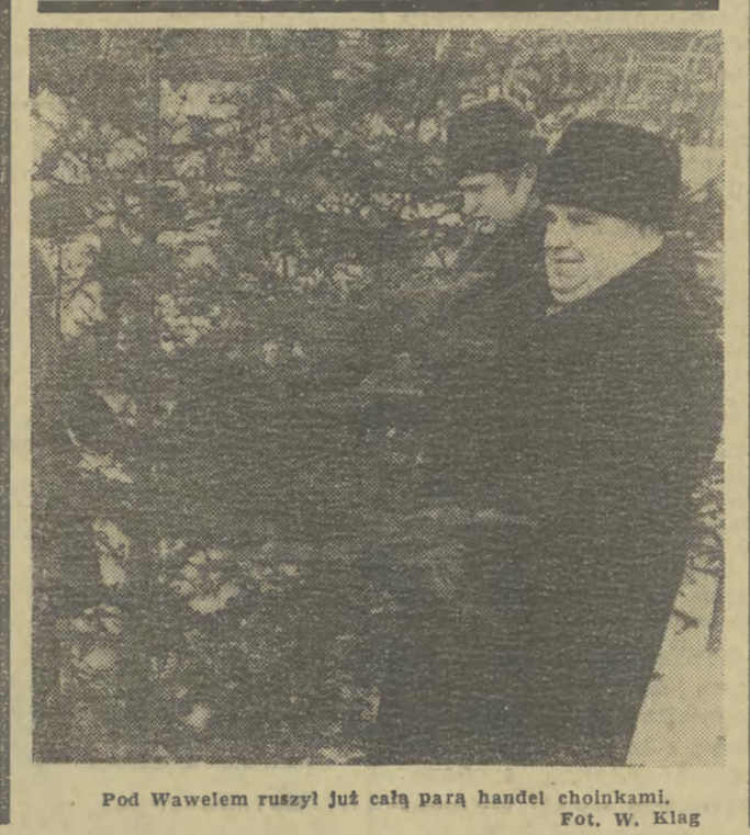
Pod Wawelem ruszył już całą parą handel choinkami.

tycznych rządów, odzwierciedlających wyzwolenie dążenia południowoamerykańskich republik”. WŁOCHY Uporczywe walki strajkowe metalowców przyniosły pierwsze rezultaty. Zawarta została umowa zbiorowa dotycząca 300 tys. pracowników państwowego przemysłu metalowego, przewidująca podwyżkę płac, zwiększenie praw związkowych w przedsiębiorstwach, skrócenie tygodnia roboczego. Przewiduje się, że te same warunki uzyska również 1 milion robotników prywatnego przemysłu metalowego i maszynowego. KUBA Komitety obrony rewolucji — najbardziej masowa organizacja społeczna — ustanowiły honorową odznakę „Stulecia W. I. Lenina”. Będą nią odznaczani ludzie, którzy zasłużyli się najlepiej przy organizowaniu imprez masowych, związanych z jubileuszem leninowskim.