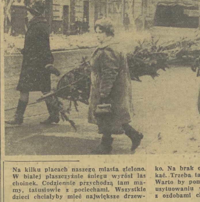
Na kilku placach naszego miasta zielono. W białej płaszczyźnie snegu wyrosł las choinek. Codziennie przychodzą tam mamy, tatusiowie z pociechami. Wszystkie dzieci chciałyby mieć największe drzewko. Na brak choinek nie możemy narzekać. Trzeba także zaznaczyć, że są ładne. Warto by pomyśleć w przyszłym roku o usytuowaniu w pobliżu choinek stoiska z ozdobami choinkowymi.

Otwarcie galerii rzeźby i malarstwa jest formą wychowawanego tym skuteczniej, że poparte jest cyklem wykładów o sztuce, jakie dla uczniów tej szkoły prowadził będzie prof. Władysław Hodys. (jmc)