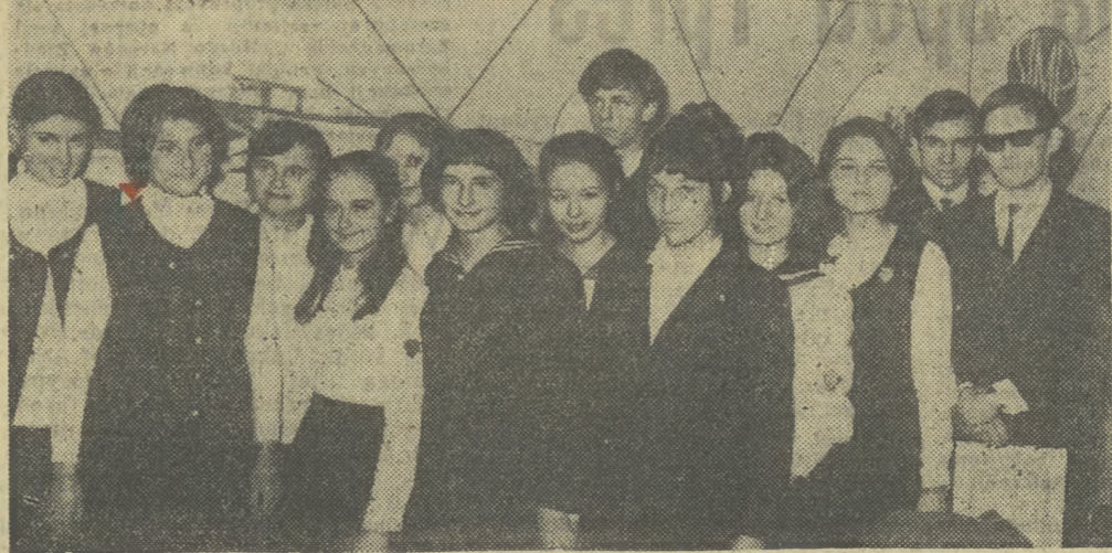
Laureaci konkursu „Kraków wczoraj, dziś i jutro“.

KAIR (PAP) Jak oznajmił sekretarz generalny Ligi Arabskiej C. Hasuna, rząd Ludowej Republiki Południowego Jemenu zaakceptował propozycję Ligi Arabskiej w sprawie zwołania nadzwyczajnej rady Ligi Arabskiej do Rabatu,