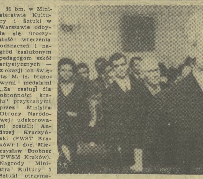
Na zdjęciu: w imieniu nagrodzonych przemawia Mieczysław Wejman — rektor ASP w Krakowie, odznaczony dzień wcześniej „Medalem Komisji Edukacji Narodowej”.