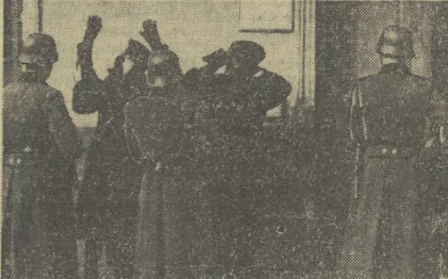
To zdjęcie także zostało rozpoznane. Wykonano go w rejonie Rynku Kleparskiego w Krakowie...

(Inf. wł.) Powodzenie wystawy fotografii pt. „Dokumenty z lat wojny 1939—1945” zorganizowanej w Krakowskim Towarzystwie Fotograficznym przekroczyło oczekiwania. Codziennie wystawę zwiedza około 5 tys. ludzi, starszych i młodszych. Przystają przed unikalnymi fotografiami (DOKOŃCZENIE NA STR. 2)