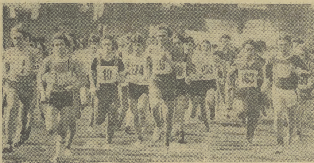
Fragm. biegu o „Złota Ciemka”.