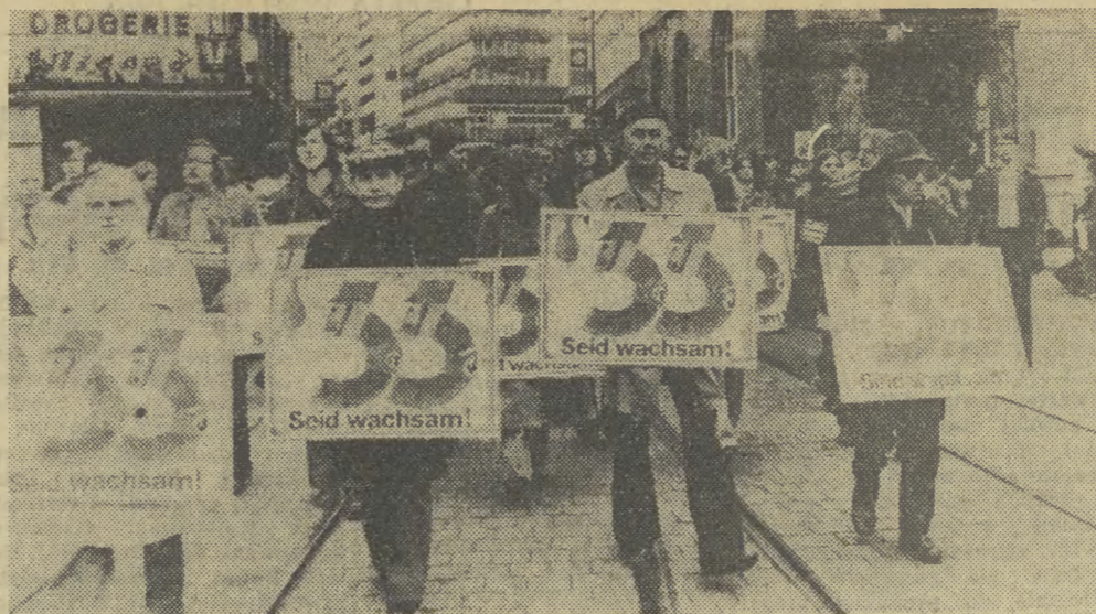
Mieszkańcy Kassel (RFN) protestują przeciwko organizowanemu w tym mieście zjazdowi byłych SS-manów. W ponad 100 miastach RFN odbywają się regularnie spotkania byłych SS-manów

oraz ich sympatyków. Opinia publiczna z niepokojem patrzy na wzrost aktywności neohitlerowskiej.