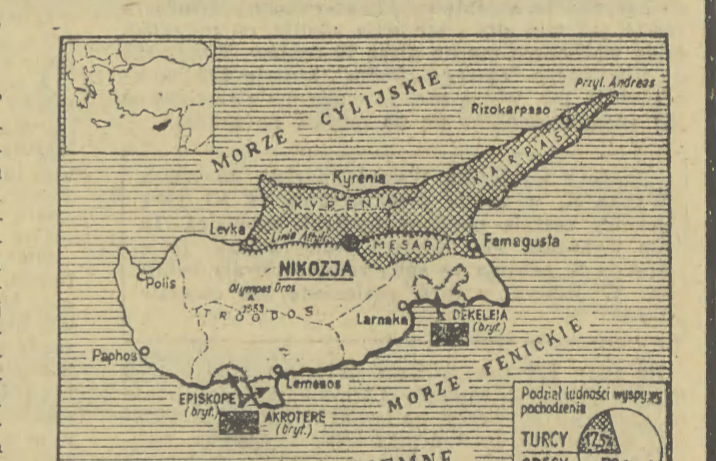
Mapa regionu wschodniego Morza Śródziemnego