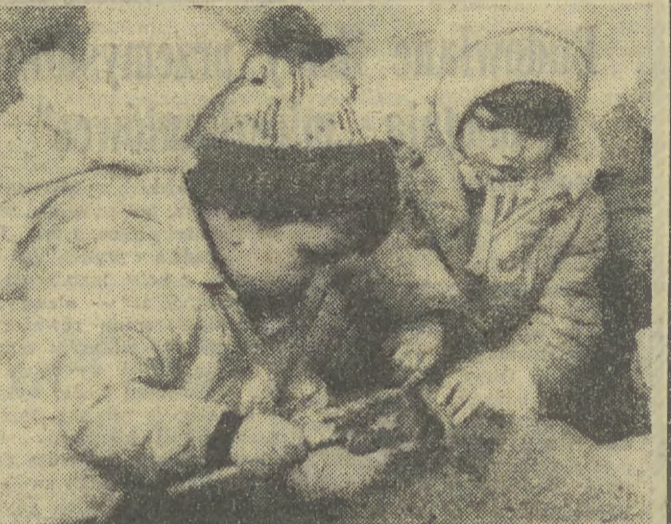
Ocieplenie sprawiło, że maluchy nieco wcześniej niż do roku rozpoczęły sezon w piaskownicy. To znak, że wiosna tu...

● „Południe” buduje na Starej Olszy ● Całość rocznych zadań — o miesiąc wcześniej ● Dwa budynki zamiast w 1979 — już w 1978 (Inf. wł.) W roku bieżącym zadania krakowskiego budownictwa mieszkaniowego wzrasta o 11 proc., do 397 tys. m kw. Jest to wzrost poważny i wykonanie planu bez pomocy budowlanych firm przemysłowych nie byłoby możliwe. W ramach tej pomocy „Południe” wzięło na siebie 20 tys. m kw., tyleż „Zetbeem”, 10 tys. „Budostal”, 5 tys. „Energoprzem”. Jak przebiega realizacja tych zadań? Jesteśmy na Starej Olszy, gdzie 165 pracowników „Krakobudu 1”, „Krakobudu 2” i „Chemobudowy”, a więc najlepszych firm „Południa”, pracuje przy budowie 13 budynków mieszkalnych. Okazuje się, że załogi przemysłowe, pomimo braku doświadczenia w budownictwie mieszkaniowym, wzięły się ostro do roboty i pokonując różniczne trudności — do brzo wykonują swoje zadania, ba, przespieszają je! (DOKONCZENIE NA STR. 2)