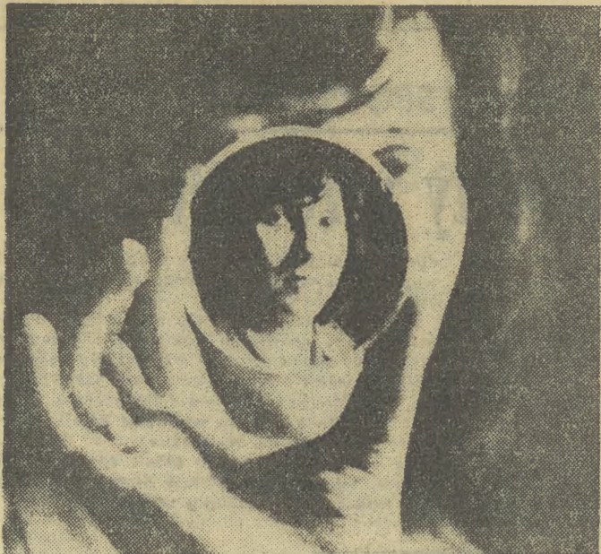
Jeleniogórskie Zakłady Optyczne są jedynym w kraju producentem szkła optycznego — wytwarza się go aż 200 rodzajów i robi 1000 wyrobów optycznych.

PROLETARIUSZE WSZYSTKICH KRAJÓW ŁĄCZCIE SIĘ!