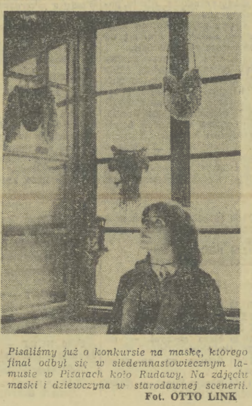
Pisaliśmy już o konkursie na maskę, którego finał odbył się w siedemnastowiecznym lamusie w Pisarach koło Rudawy. Na zdjęciu maski i dziewczyna w starodawnym scenarii.

LONDYN (PAP). Brytyjski minister spraw wewnętrznych, Merlyn Rees wydał nakaz opuszczenia W. Brytanii przebywającemu w tym kraju przywódce reakcyjnej amerykańskiej organizacji rasistowskiej Ku-Klux-Klan, Davidowi Duke'owi. Duke, który jest „wielkim diakonem” Ku-Klux-Klanu przybył do W. Brytanii dla wymiany doświadczeń z rasistowskimi organizacjami obu krajów. Decyzja ministra Reesa została wydana pod naciskiem postępowej i liberalnej opinii publicznej, w poważnym stopniu zaniepokojonej związaną z wizytą D. Duke'a kampanią propagandową rasistowskiej, wymierzoną przeciwko ludności kolorowej w W. Brytanii. Według informacji podanych w środkach masowego przekazu, londyńska policja nie może znaleźć Davida Duke'a, by wręczyć mu nakaz wyjazdu z W. Brytanii. Jednakże „wielki diakon” Ku-Klux-Klanu znalazł sposób na kontakty z amerykańskimi fotoreporterami oraz na udzielenie wywiadu brytyjskiej sieci telewizyjnej BBC.