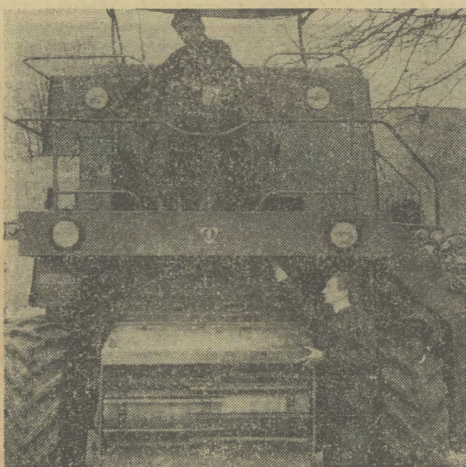
Po trudnej ubiegłorocznej akcji żniwnej kombajny przecho- dzą gruntowne naprawy w ośrodkach maszynowych. POM w Głogowie przygotowuje do nowego sezonu 70 „Bizonów”.