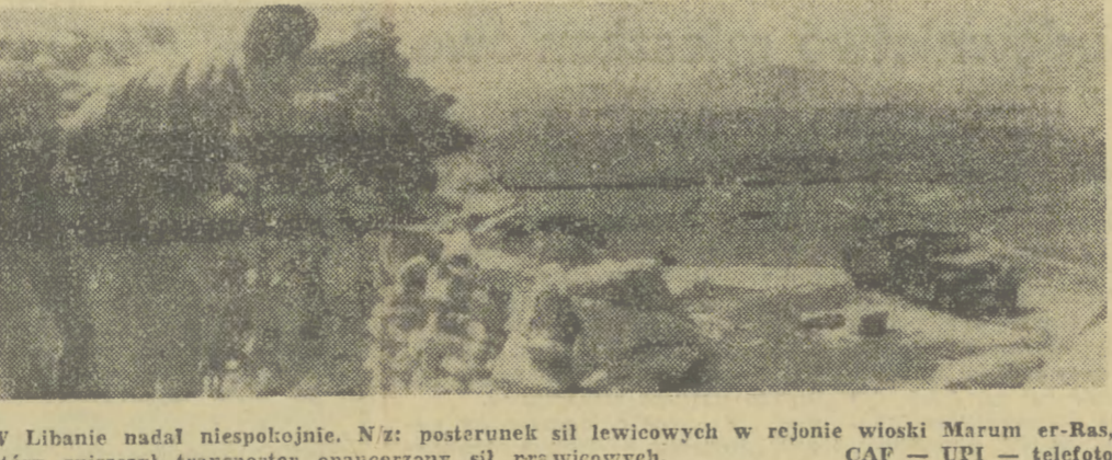
W Libianie nadal niespokojnie. Niz posterunek sił lewicowych w rejonie wioski Marum er-Ras, który zniszczył transporter pancerny sił prawicowych.

BRYM (PAP). Konserwatywny polityk bawarski Franz Josef Strauss pojawił się w Bolzano na 20 dorocznym spotkaniu „południowotyrolskiej ligi strzelców”, organizacji Tyrolczyków zamieszkujących Górny Adyge. Nawoływał on uczestników tego zebrania do wznowienia wysiłków, w celu przeciwdziałania się komunizmowi we Włoszech. Strauss wywał Włochów, mówiących po niemiecku, aby przeciwstawiali się wszelkim systemom politycznym o „ideologii kolektywistycznej”. W zebraniu z udziałem Straussa uczestniczyło około 600 mówiących po niemiecku członków ligi oraz goście z Austrii i Niemiec Zachodnich. Pojawienie się Straussa wywołało protesty ze strony lewicy. Polityka nie dopuściła demonstracji do budynku, w którym odbywało się zebranie, ządali oni aby Strauss wyńsił się z Włoch, zaś delegatów ligi południowotyrolskiej określali jako „sturmtruppen”. Wystąpienie Straussa w Bolzano uznano za jawną, fałszywą prowokację przeciwko ruchowi robotniczemu i przeciwko mieszkańcom Górnej Adygi.