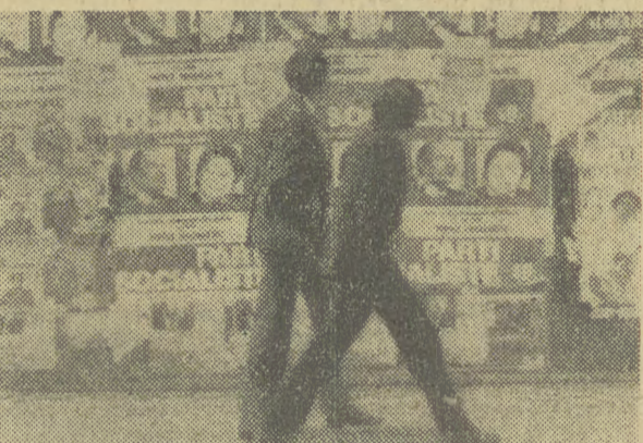
Ulice Paryża oblepione są plakatami partii politycznych, przed wyborami parlamentarnymi, które odbędą się 12 i 19 marca br.

Dla zapewnienia terminowego wykonania planu budowy elektrowni i elektrociepłowni ziemienne ważne staje się również usprawnienie budownictwa energetycznego. (DOKOŃCZENIE NA STR. 2)