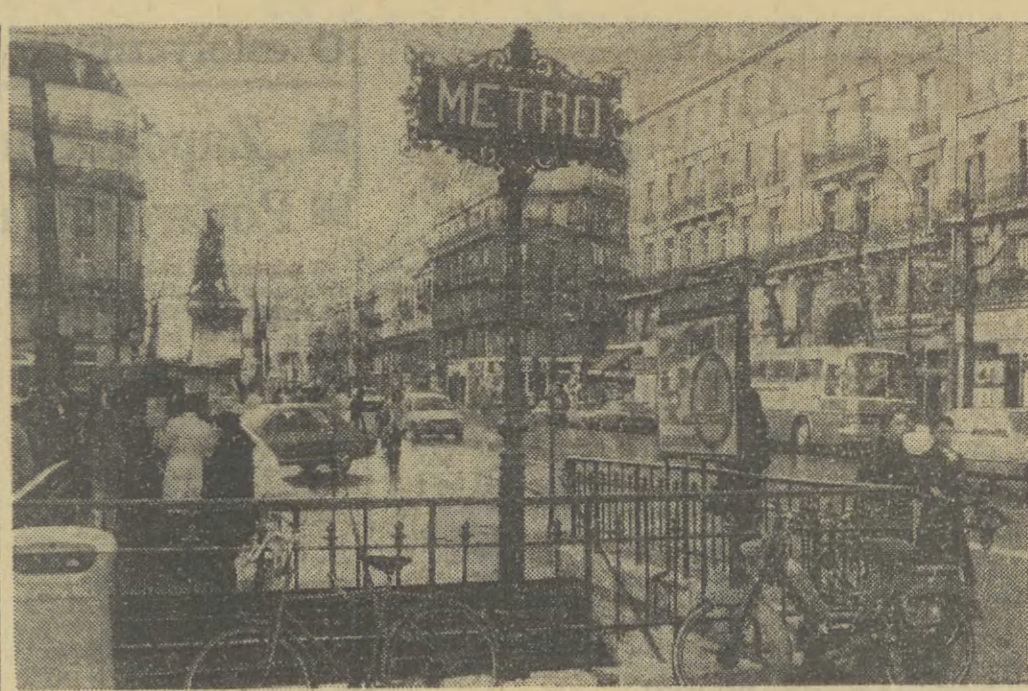
Francja. Wejście na jedną ze stacji metra w centrum Paryża.

Rzadko się też zdarza, aby młody pianista bisował kilkakrotnie po recitalu i został obrzucony na scenie kwiatami — napisał recenzent londyńskiego „Timesa”, porównując błyskotliwość techniki Zimmana, piękno tonu i finezję z klasą Lipińskiego i Rubinsteina. Na twórcy charakter wykonania Zimmana, jego wspaniałą technikę i postykę otwarczenia muzyki Chopina zwrócił uwagę recenzent „Guardiana”.