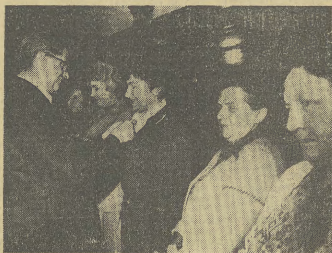
Moment dekoracji.