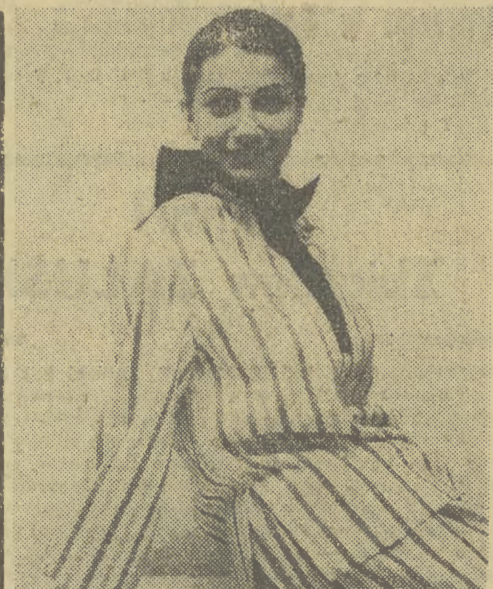
Radomski „MODAR” dla pań

Po kilku latach przerwy, znów spotkaliśmy