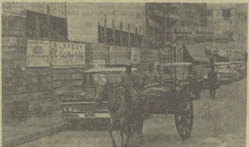
Kolumbia — fragment centrum Bogoty.