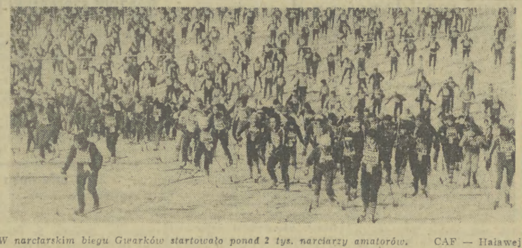
W narciarskim biegu Gwarków startowała ponad 2 tys. narciarzy amatorów.

Wojewódzki program budownictwa mieszkaniowego przewiduje w tym roku oddanie (DOKONCZENIE NA STR. 2)