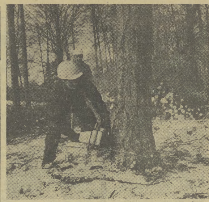
Leśne żniwa trwają.

CZWARTEK, 2. III. 1978 R. ■ NR 50 (9273) ROK XXX ■ CENA 1 ZŁ ■ WYD. A