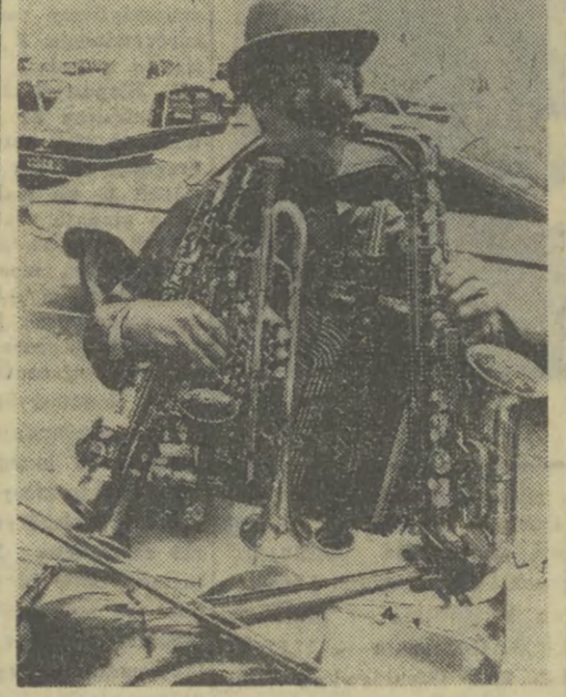
Multinstrumentalista z Hamburga smany pod pseudonimem „Colle” i 12 instrumentów, na których gra.

Naukowe i praktyczne znaczenie rejestracji promieniowania rentgenowskiego Słońca jest ogromne, pomaga bowiem w uzyskaniu informacji o najgorętszej strefie Słońca — jego koronie. Tu właśnie rozpoczyna się strumień cząstek naładowanych — korpuskuł, które określają charakter związków między Słońcem a Ziemią. Mają one duży wpływ na to, co się dzieje na Ziemi, m. in. na stan łączności oraz — jak przypuszczają naukowcy — na wybuchy epidemii grypy.