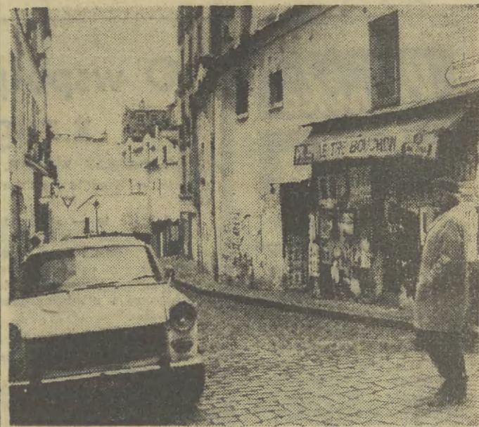
Francja. Zaulek w starej części Paryża.

WTOREK, 28. II. 1978 R. • NR 48 (9271) ROK XXX • CENA 1 ZŁ • WYD. A