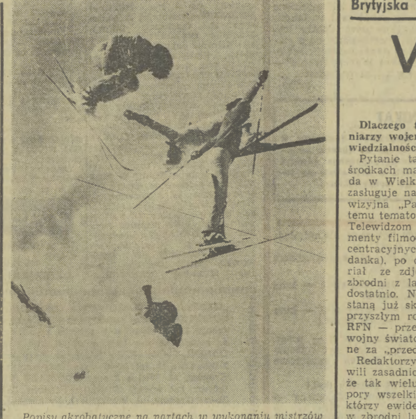
Popisy akrobaticzne na nartach w wykonaniu mistrzów tego sportu w Alpach francuskich.

SPAWANIA elektrycznego i gazowego — oraz PALACZY centralnego ogrzewania i kotłów wysokoprężnych — organizuje Zakład Doskonalenia Zawodowego w Krakowie. — Wpisy: Kraków, ul. DIETLA 38 tel. 639-41 — oraz ul. FLORIAŃSKA 20 tel. 228-90, 271-30. K-941