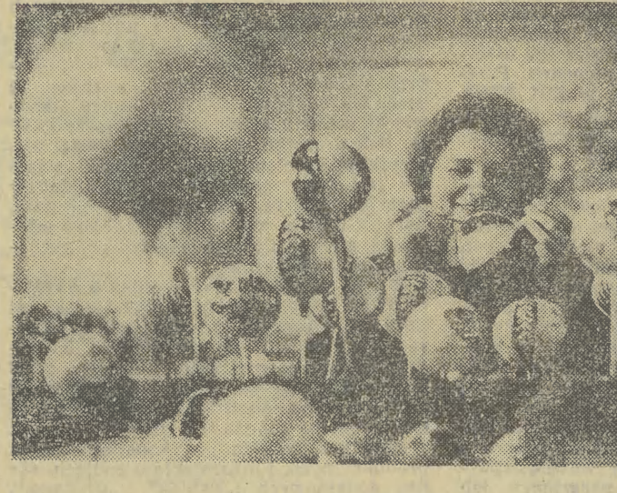
Ozdób na nasze choinki nie zabraknie.

Pardayan przyjął go z łakomą miną drakuli, który widzi zbliżającą się do siebie, zreygnowaną ofiarę, ale Flicker tak był pograżony w swoich sprawach, że nawet nie zauważył jego wielkich zębów wampira.