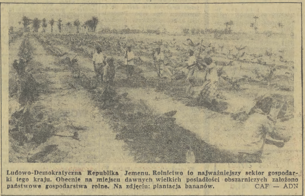
Ludowo-Demokratyczna Republika Jemenu. Rolnictwo to najważniejszy sektor gospodarki tego kraju. Obecnie na miejscu dawnych wielkich posiadłości obszarowych założono państwowe gospodarstwa rolne. Na zdjęciu: plantacja bananów.