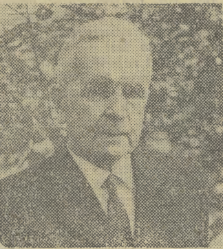
Przewodniczący Rady Państwa prof. HENRYK JABŁOŃSKI

Prowadzone przez Profesora seminaria miały charakter rodzinnego spotkania ale spotkania uroczystego. Uczestniczyli na nie studenci prawa, filozofii, historii, pedagogiki. Działalność pobudzającą na studentów, fascynował pracą twórczą, zachęcał do badań.