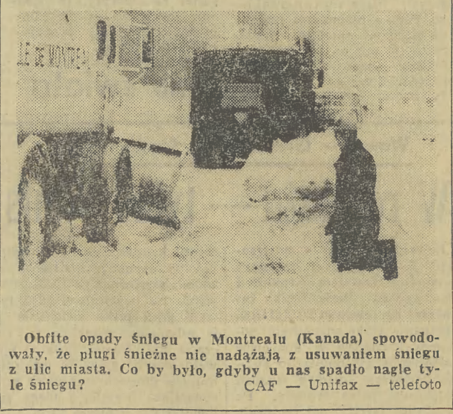
Obfite opady śniegu w Montrealu (Kanada) spowodowały, że piugi śnieżne nie nadążają z usuwaniem śniegu z ulic miasta. Co by było, gdyby u nas spadło nagłe tyle śniegu? CAF — Unifax — telefoto