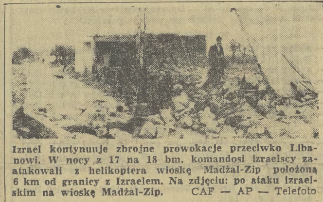
Izrael kontynuuje zbrojne prowokacje przeciwko Libanowi. W nocy z 17 na 18 bm. komandosi izraelscy zatakowali z helikoptera wioskę Madżal-Zip położoną 6 km od granicy z Izraelem. Na zdjęciu: po ataku izraelskim na wioskę Madżal-Zip.

NOWY JORK (PAP) 18 grudnia, w późnych godzinach nocnych, po jednastu tygodniach wyjątkowej pracy, zakończyła swe obrady XXIX Sesja Zgromadzenia Ogólnego ONZ. W ostatnim dniu Zgromadzenie Ogólne zatwierdziło program działania dotyczący ustanowienia nowego międzynarodowego ładu ekonomicznego i zaleceń 6 specjalnej sesji Zgromadzenia Ogólnego NZ, finansowania sił pokojowych ONZ na Bliskim Wschodzie, jak również uzupełnień do budżetu ONZ na lata 1974-1975. Zabierając głos w imieniu krajów wspólnoty socjalistycznej przedstawiciel NRD w ONZ, ambasador Peter Florin, oświadczył iż sesja podjęła decyzje mające istotne znaczenie dla dalszego umocnienia procesów odprężeniowych w świecie oraz rozwiązywania problemów międzynarodowych w oparciu o zasady suwerennej równości i realizmu. Reprezentanci innych grup regionalnych i politycznych podkreślili konieczność przestrzegania Karty NZ i realizowania postanowień i rezolucji ONZ jako warunku niezbędnego i zasadniczego pozytywnej działalności ONZ i utrwalenia międzynarodowego porządku prawnego. Sytuacja na Bliskim Wschodzie nie była przedmiotem debaty XXIX sesji i punkt poświęcony tej sprawie pozostaje nadal na porządku dziennym sesji. Dlatego XXIX sesja, podobnie jak sesja XXVIII, nie została formalnie zamknięta, a jej obrady zostały zawieszane i mogą być w każdej chwili wznowione.