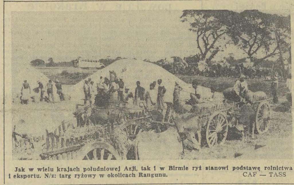
Jak w wielu krajach południowej Azji, tak i w Birnie rył stanowi podstawę rolnictwa i eksportu. N/z: targ ryżowy w okolicach Rangunu.