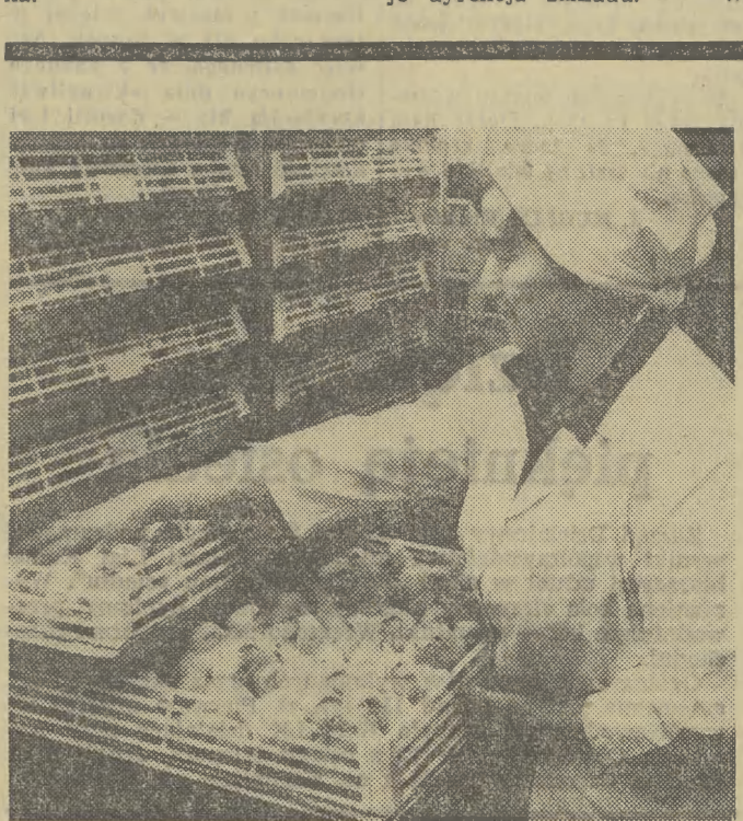
Pomorskie Zakłady Drobnarckie mln sztuk plisłat. Na zdjęciu: zakład wylęgu drobiu w Chelmnie koło Torunia posiada nowoczesne halowe aparaty wylęgogodyskowe. Rocznie skupuje się tu około 250 milionów jaj. Wylęgarnie dostarczają rocznie 14