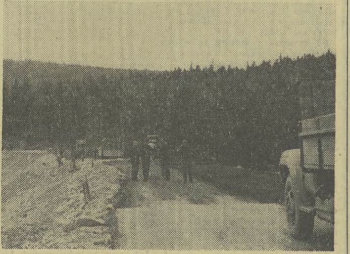
Jak już donosiłmy droga przed Krynicą ulega modernizacji. Nivuluje się wzniesienia, łagodzi krzywizny. Prace prowadzi Wojewódzki Zarząd Dróg Publicznych w Krakowie.

WASZYNGTON (PAP) W kołach politycznych Waszyngtonu krąży pogłoski o możliwości wznowienia rozmów przedstawicieli wielkich mocarstw na temat Bliskiego Wschodu w związku z napiętą sytuacją w tej stronie po podpaleniu meczetu w Jeruzolimie. Oczekuje się, że dwustronne rozmowy radziecko-amerykańskie będą