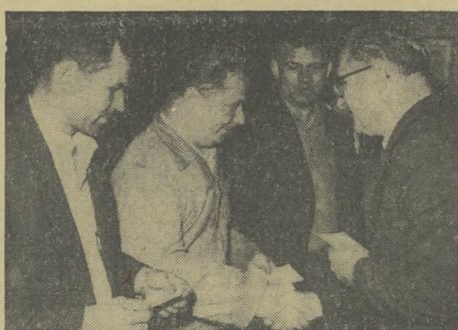
Nowi członkowie i kandydaci partii

Nie odczuwa się natomiast braku w zaopatrzeniu w czapki, berety, koinierzyki, torbistery i te czki. (bpor)