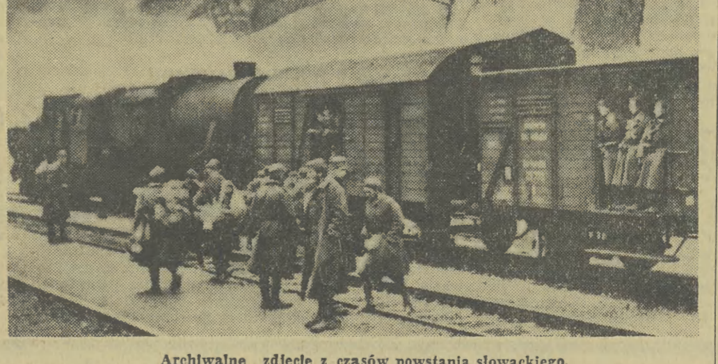
Archwalne zdjęcie z czasów powstania słowackiego.