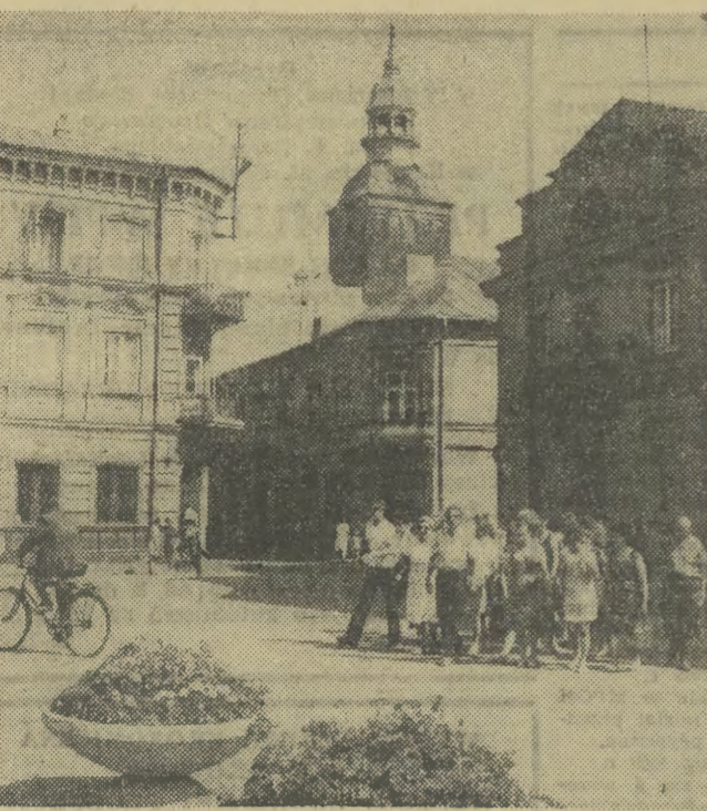
Plac Trybunalski w Piótkówko Trybunalskim.