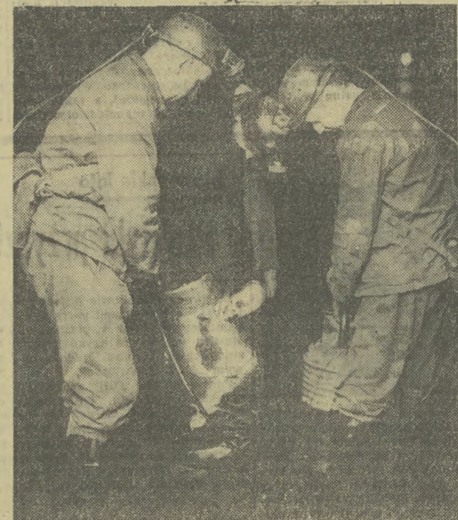
Wypompowywanie wody z chodników.

Od kilku tygodni śledzimy z uwagą walkę ratowników kopalni Zawadzki o przywrócenie zakładowi jego normalnego życia. Nie zapomnieliśmy tamtych dramatycznych