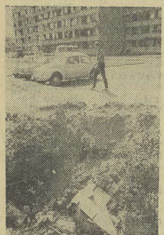
Taki mały dworzec... straszdyło