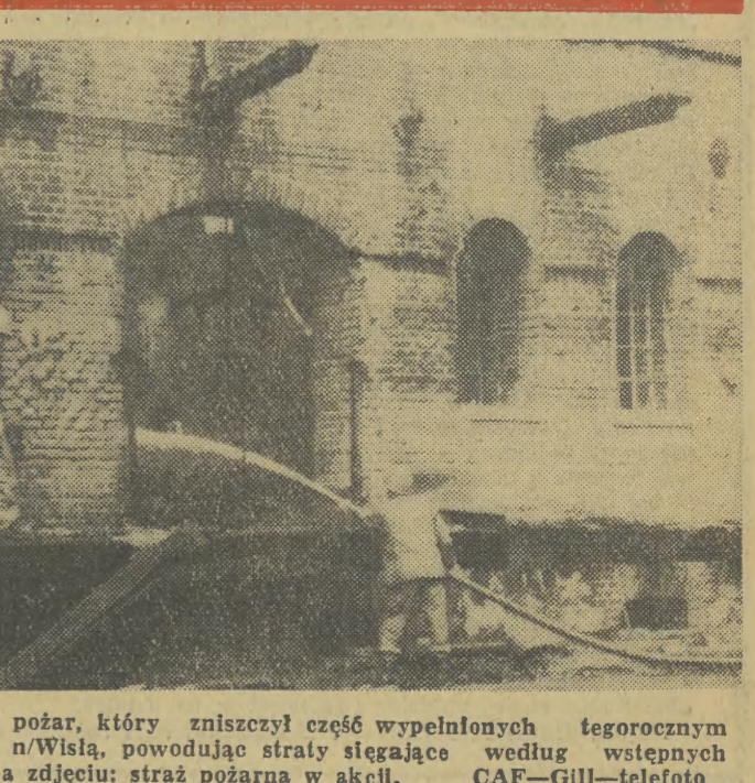
W nocy 18 bm. wybuchł wielki pożar, który zniszczył część wypełnionych tegorocznym zbożem magazynów w Świeciu n/Wisła, powodując straty sięgające według wstępnych szacunków sumy 10 mln zł. Na zdjęciu: straż pożarna w akcji.

W nocy z wtorku na środę premier Harold Wilson oświadczył, że odpowiedzialność za bezpieczeństwo Irlandii Północnej obejmuje armia brytyjska. Nad całością sił policyjnych Ulsteru ma czuwać lokalny dowódca wojsk brytyjskich generał Freeland. Kontyngenty specjalnej rezerwy policyjnej mają być stopniowo rozbrajane i wycofywane z miast, a na przyszłość mają nie brać udziału w tłumieniu rozruchów. Wojska brytyjskie — oświadczył premier Wilson — pozostaną w Irlandii Północnej dopóty,