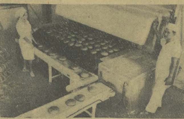
Pieczywo — opuszcza piec...

Wzrosłym żłobkiem tygodniowym w Nowej Hucie — jest żłobek nr 15 w os. Krakowiaków.