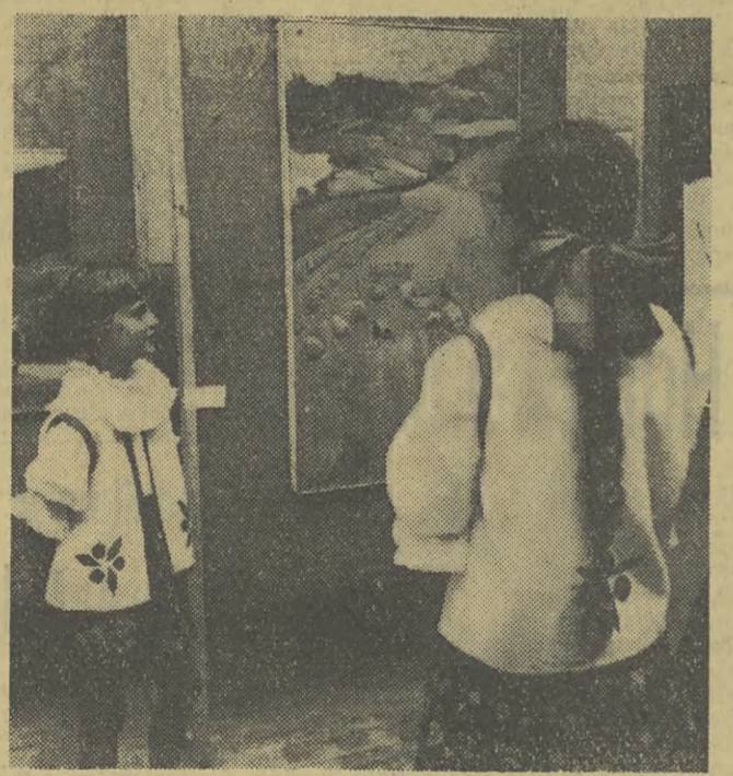
W Szczyrku, woj. katowickiej, zorganizowana została wystawa twórczości artystów ludowych z regionu beskidzkiego. Można tu zobaczyć interesujące rzeźby w drzewie, wyroby z metalu oraz ceramikę, twórczość malarską.

LONDYN (PAP) W dniu wczorajszym siły amerykańskie poniosły w Wietnamie Południowym duże straty w walce z oddziałami narodowowyzwoleńcymi. Parzyanci zestrzelili 3 helikoptery USA. 20 żołnierzy USA poniosło śmierć, a 42 zostało rannych. Jeden z helikopterów został zestrzelony w prowincji Binh Dinh, a 2 pozostałe w odległości 56 kilometrów od południe od amerykańskiej