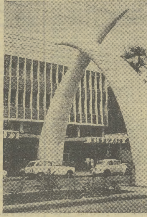
Kenia, Kilindini Road — wizytówka Bombasy, największego portu morskiego kraju.

Była to pod wieloma względami sesja rekordowa. Miała ona m. in. największy — liczący 131 punktów — porządek dzienny, a w jej debacie generalnej uczestniczyło 142 mówców.