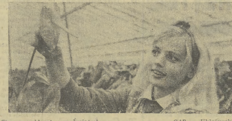
Zimą w szklarni przy kwiatkach.

PARYŻ (PAP). Według ostatnich doniesień agencji AFP, w wypadkach drogowych, do jakich doszło w śróde z powodu gęstej mgły i gołolezi na autostradach francuskich, zginęło 8 osób, a 165 zostało rannych.