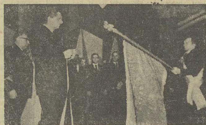
Kazimierz Barcikowski dokonuje aktu dekoracji.

(Inf. wł.) Wczoraj zakładowy sztandar Krakowskiej Fabryki Kabli udekorowany został wysokim odznaczeniem państwowym — Orderem Sztandaru Pracy I klasy. Aktu dekoracji dokonał zastępca członka Biura Politycznego KC PZPR, i sekretarz Komitetu Krakowskiego Partii Kazimierz Barcikowski.