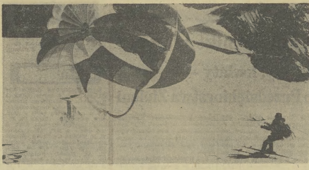
Sapodochron i narty to propozycja dla amatorów silnych emocji.

WARSZAWA (PAP). Polska Stacja Archeologii Śródziemnomorskiej rozpoczęła kolejny zimowy sezon wykopalisk w Egipcie i Sudanie. Z początkiem 1978 r. wznowione zostaną wykopaliska na terenie Nubii — w ruinach starożytnej twierdzy nad Nilem w Kasr Ibrahim, oraz w starej Dongoli — średnio-wiecznej stolicy Nubii. Przerwa w badaniach spowodowana została koniecznością opracowania zebranych wcześniej materiałów. Kontynuowane będą badania w Kadero w Sudanie i prace w Deir el Bahari, gdzie polscy specjaliści pracują przy rekonstrukcji świątyni królowej Hatszepsut. Jak informuje prof. Kazimierz Michałowski — rok 1977 był pomysłny dla naszej archeologii śródziemnomorskiej. Polskie wykopaliska w Palmirze w Syrii przyniosły interesujące odkrycia. W pobliżu miasta, gdzie przed kilku laty polska ekspedycja odkopła posąg Ateny — znaleziono w tym roku 3,5-metrową rzeźbę Iwa z I w.n.e. W Nea Paphos na Cyprze, gdzie Polacy badają ruiny pałacu rzymskiego gubernatora, znaleziono dalsze fragmenty tej budowli oraz relikwiarzy starożytnych. Na terenie pałacu zebraano też bogatą kolekcję rzeźb różnej wielkości. W Kadero w Sudanie polscy archeolodzy badali ślady osadnictwa na starożytnych wzniesieniach i reliktach z IV tysiąclecia p.n.e. Prowadzone były także prace archeologiczne i konserwatorskie w Aleksandrii — na terenie odkrytej przez Polaków starożytnej dzielnicy mieszkaniowej z okresu późnorzymskiego i wczesnonobizantyjskiego, w Deir el Bahari, na wyspie Elefantynie.