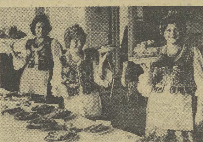
Okazali i smakowicie prezentuje się przedświąteczny klermass zorganizowany przez Rejonową Spółdzielnię „SCH” w Niepolomicach.