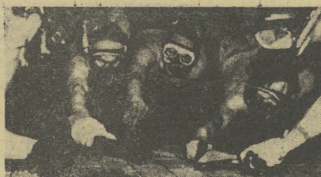
W Londynie rozegrany został pierwszy międzypaństwowy mecz w nowej dyscyplinie sportowej, jaką jest podwodny hokej. W imprezie tej reprezentacja Anglii pokonała Holandię 4:0. N/z: fragment spotkania.

Według najnowszych doniesień liczba śmiertelnych ofiar katastrofy samolotu wynosi 19 osób, 21 osób wyciągniętych z wody przez ratowników penetrujących okolice katastrofy na łodziach ratunkowych odesłano już do szpitala. Ich życiu nie zagraża niebezpieczeństwo. Większość uratowanych jest w stanie szoku. Akcja poszukiwania brakujących 17 pasażerów samolotu trwa.