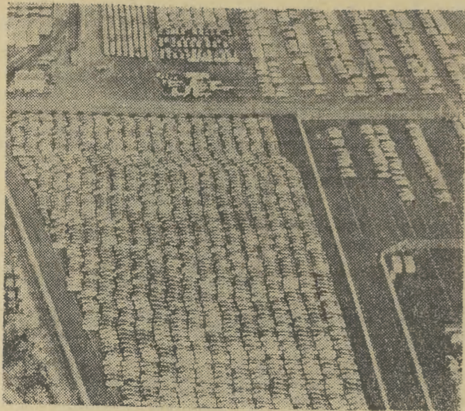
Przemysł samochodowy na ścieżce systematycznie notuje wzrost produkcji. Nasze zdjęcie przedstawia parking fabryczny zakładów „Volvo”.