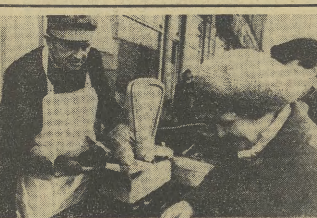
W wielu punktach miasta czynne są już uliczne stoiska, w których sprzedaje się karpie na święteczne stoly.

Klub Młodych (os. Miodoci 1); Spektakl Teatru Jednego. Aktora „Jak to było naprawdę” wg A. Slonimskiego w wyk. W. Siemiona — 18 Klub „Starówka” (Szczepańska 5); „Co nowego w kraju i świecie” — mag. filmowy prowadzi mgr E. Jakóbek — 18.