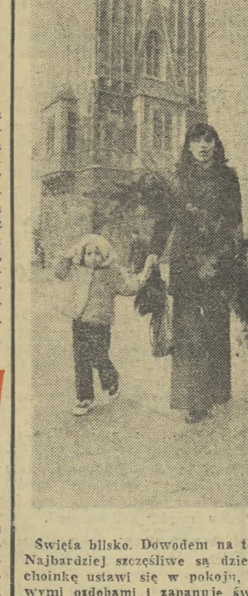
Święta blisko. Dowodem na to jest to zdjęcie. Najbardziej szczęśliwe są dzieci. Za kilka dni chyniłek ustawi się w pokoju, przystroji kolorowo i wiozą osobami i zapanuje świąteczny nastrój.

MOSKWA (PAP). W niedzielę w Jakucji (północna Syberia) zanotowano rekordowe o tej porze roku mrozy. W Wierchojańsku termometr spadł do minus 58 stopni Celsjusza, a w Ojma-konie — do minus 60 stopni. Obole te miejscowości znane są jako błędy zimna na półkuli północnej.