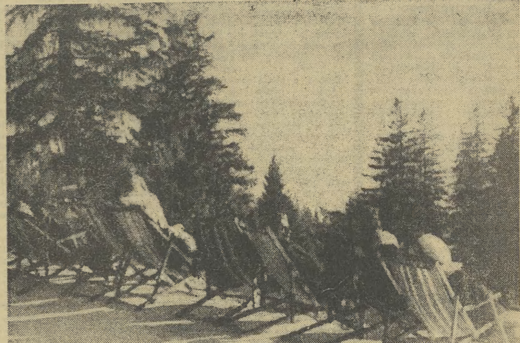
Na „pastelni” na Gubalówce.

WASZYNGTON (PAP). Przygotowania do podróży prezydenta Cartera, w czasie której złoży on wizyty w Polsce i innych krajach, budzą w Waszyngtonie coraz większe zainteresowanie, są przedmiotem licznych komentarzy, wypowiedzi, doniesień prasowych. Doradca prezydenta ds. bezpieczeństwa Zbigniew Brzezinski w wywiadzie telewizyjnym, w którym omawiał swoją pracę w Białym Domu, mówił również o politycznych przygotowaniach do podróży. Podkreślił, że celem wizyt nie jest podpisywanie jakichkolwiek no-