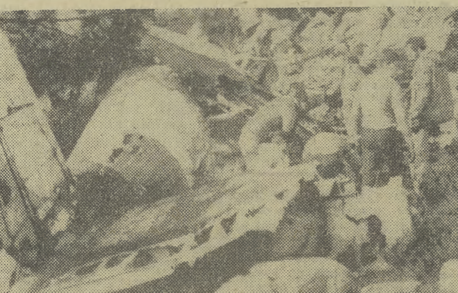
14 bm. w górach Sierra de Guadarrama w Hiszpanii rozbił się samolot wojskowy RFN Heinkel 111. 4 osoby załogi poniosły śmierć.

W ciągu całej kadencji rady narodowe stopnia podstawowego zajmowały się też realizacją wniosków i postulatów, zgłoszonych w czasie kampanii wyborczej w 1973 r. oraz podczas spotkań z radnymi. Większość wniosków o charakterze gospodarczym (a było ich w sumie 1360) uwzględniono w planach rozwoju miast i gmin. Wykonano prawie wszystkie decyzje dotyczące budownictwa drogowego, jednak wiele wniosków o charakterze inwestycyjnym, wymagających wysokich nakładów finansowych, będzie wcielanych w życie w latach następnych. (al)