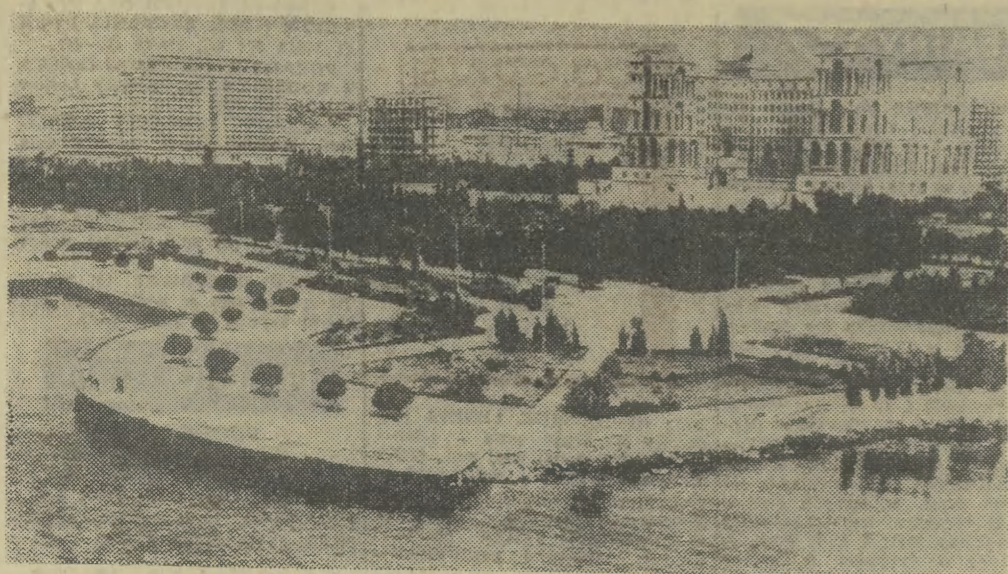
ZSSR. Panorama Baku od strony Morza Kaspijskiego.