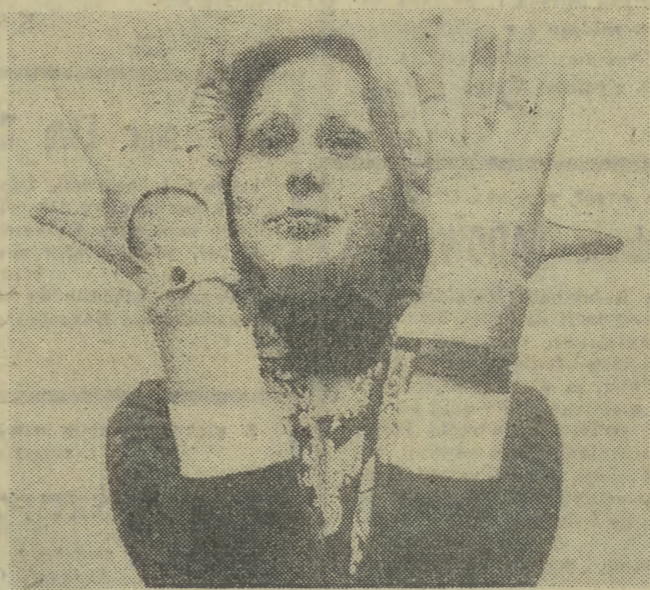
Od wielu lat Fabryka Rękawiczek i Odzieży Skórzanej w Miastku (woj. śląskie) słynie z modnych, wykonywanych w krótkich seriach, wyrobów ze skórzanej skóry. N/Z: rękawiczki z kolekcji przygotowanej na plerwusze półroczu 1978 r.

Wystawa pokonkursowa ma być eksponowana w zabytkowym dworcu Sądęckiego Parku Etnograficznego i uświetniona zwiędającym w maju 1978 r.