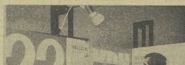
Wczoraj w „Kabl” otwarta została wystawa poświęcona dziejom ruchu robotniczego. Ekspozycja składa się z trzech części. Pierwsza obrazuje historię ruchu rewolucyjnego od końca XIX wieku do połowy obecnego stulecia, druga to dzieje ruchu robotniczego w „Kabl” od czasu powstania fabryki, czyli r. 1928 do czasu Kongresu Zjednoczeniowego PPR i PPS w 1948 r.