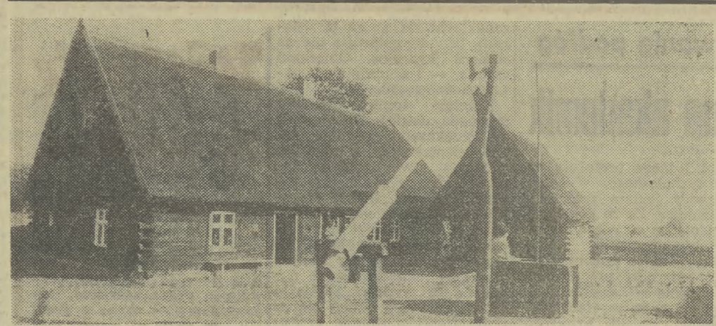
W Zielonogórskim Parku Etnograficznym.