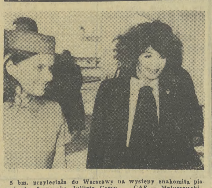
5 bm. przyjechała do Warszawy na występy znakomita piosenkarka francuska Juliette Greco.

Na tradycyjne już święto wiosny — Dni Kwitnących Sądów — Sądacyzna sprasza swych gości na 18 maja do Łącka. Obchody święta kwiatów uświetnią 25-lecie naszej Ludowej Ojczyzny a także — rozświetli piękno ziemi sądeckiej i jej folkloru. Poprzedzi je w dniu 17 maja sympozjum naukowców z sądownikami w Brzesnej.