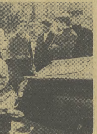
W sobotę o godz. 13 na ul. Basztowej zderzyła się 2 samochody. A oto efekt kolizji.