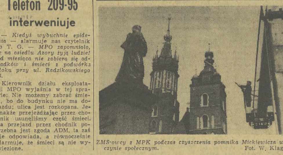
ZMS-owcy z MPK podczas czyszczenia pomnika Mickiewicza w czynie społecznym.

Nieuprzejma — ukarana. Pisaliśmy kiedyś o nieuprzejmej sprzedawczyni w pawilonie handlowym na Ugorku. Jak zawiadamia nas dyrekcja PSS — została ona ukarana upomnieniem z anadotacją w sferach osobowych. Pocono również cały personel sklepu o obowiązku uprzejmej obsługi klientów ostrzegając, że w przyszłości podobne przewinienia spowodują surowe konsekwencje, do zwolnienia z pracy włącznie. (hz)