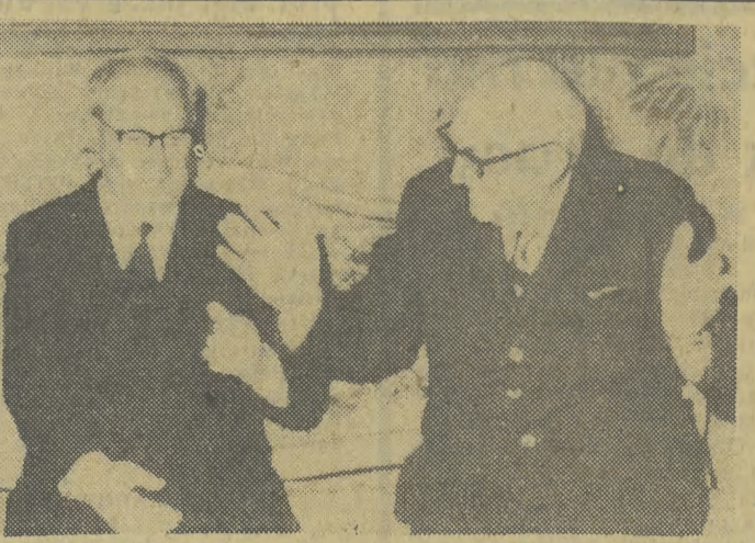
Przebywający we Włoszech sekretarz generalny ONZ U Thant (z lewej) spotkał się 5 bm. z prezydentem Giuseppe Saragatem (pośrodku) i ministrem Spraw Zagranicznych Pietro Nenni (z prawej).

To nie Hitler ponosi główną winę za wybuch drugiej wojny światowej. Taką tezę kolportuje w Niemczech zachodnich centralny organ zachodniemieckiego Związku Prześwieconych „Deutscher Ostdienst”.