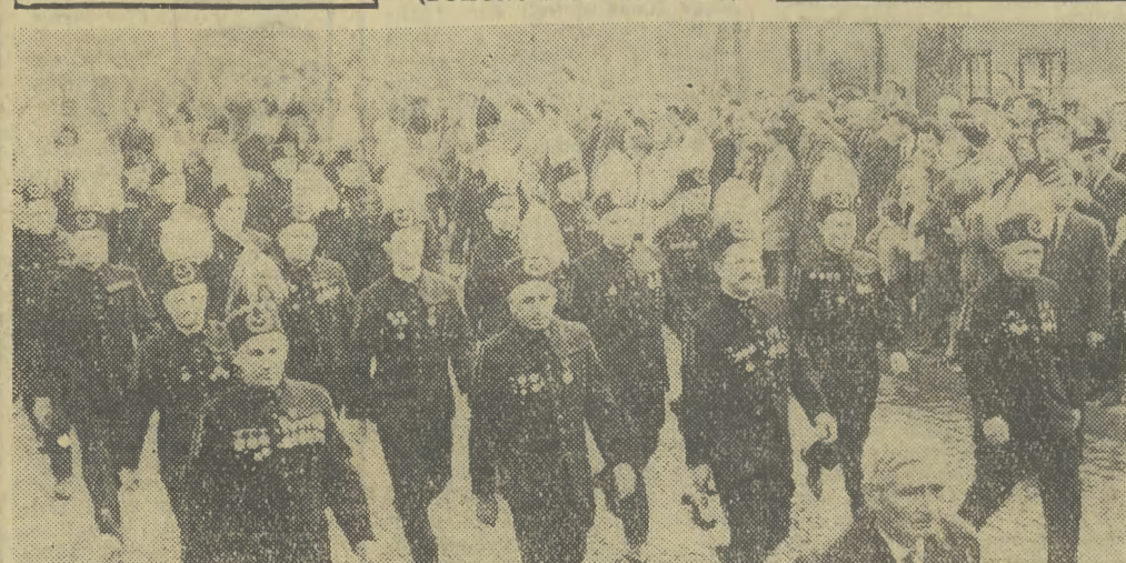
Pięknie prezentowały się w pochodzie 1-majowym w Trzebnicy-Sierszy górnicy kopalni „Siersza”, którzy niedawno otrzymali sztandar przechodni Rady Ministrów i Centralnej Rady Związków Zawodowych, za najlepsze osiągnięcia we współzawodnictwie.

W dniu dzisiejszym o godz. 17.00 Telewizja Krakowska nada specjalny reportaż filmowy z tegorocznego pochodu pierwszomajowego w Krakowie. Zapraszamy wszystkich telewidzów do obejrzenia tej imponującej na miarę jubileusz 25-lecia Polski Ludowej manifestacji mieszkańców Krakowa i ziem krakowskiej.