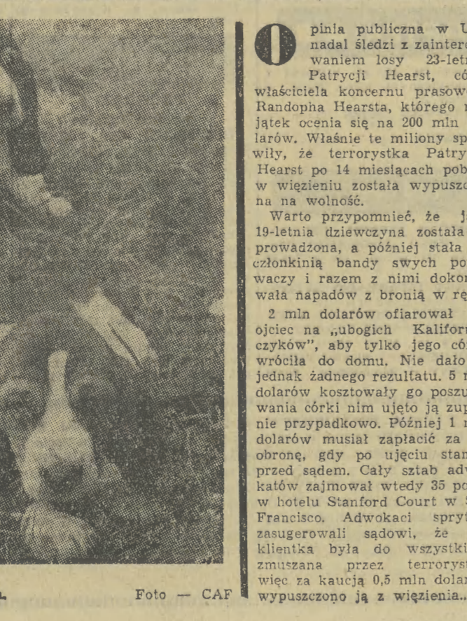
Basety w wieku niemowlęcym.