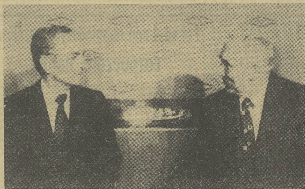
22 bm. z oficjalną wizytą przybyli do Polski ich Cesarzowski Mości Szachinszach Iranu Mohammad Reza Pahlavi Aryamehr i Cesarzowa Iranu Farah Pahlavi. Na zdjęciu: w gmachu Sejmu PRL. odbyło się spotkanie i sekretarza KC PZPR Edwarda Gierka z JCM Szachinszachem Iranu Mohammadem Reza Pahlavi Aryamehrem.

Program wizyty oficjalnej Szachinszacha Iranu i Cesarzowej Iranu, którzy goście będą w Polsce do 26 bm., przewiduje szereg spotkań i rozmów z przywódcami naszego kraju, a także podróż, w czasie której (DOKONCZENIE NA STR. 2)