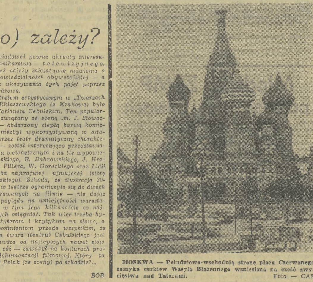
MOSKWA — Południowo-wschodnią stronę placu Czerwonego zamyka cerkiew Wasyla Blaźennego wniesiona na cześć zwycięstwa nad Tatarami.