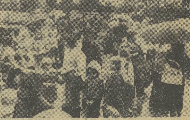
Pierwszoklasisci ze Szkoły Podstawowej nr 25 na osiedlu Podawalskim jeszcze z rodzicami.

Zgodnie z tradycją, uroczystości rozpoczęcia nowego roku szkolnego 1977/78 odbędą się 1 września, który ogłoszony został dniem „Święta szkoły”. Nasz reporter złożył wizytę w jednej z najstarszych nowosądeckich szkół podstawowych, (DOKONCZENIE NA STR. 2)