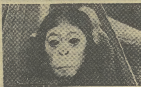
Siedmiomiesięczna szympanisa Siesi jest ulubienicą pracowników sztokholmskiego ZOO.

Film, który w następnym „polskim etapie” realizowany będzie również w Tarnowie, reżyseruje Sara Sandor. (tb)