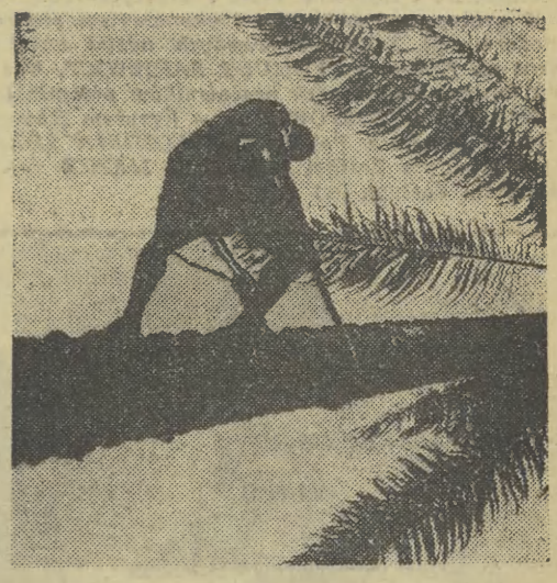
Rodowici mieszkańcy Gwineał wchodzą na drzewa palmowe z niezwykłą zwinnością.

Straty, jakie poniósł Nowy Jork i jego mieszkańcy w ciągu 25 godzin trwania awarii nadal nie są całkowicie znane. Obliczono na razie, że zniszczeniu uległo 1382 sklepy, domy handlowe i magazyny. Sama odbudowa zniszczonych pomieszczeń, urządzeń i obiektów będzie kosztować co najmniej 14 mln dol. Stwierdzono też, że najbardziej uszkodzona okazała się dzielnica Brooklyn, gdzie zniszczono, sprowadzono lub podpalono 660 sklepów, domów teatrowych, magazynów i innych obiektów.