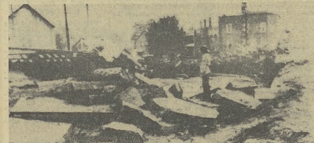
Amerykański stan Pensylwania nawiedzila nie notowana tu od wielu lat powódź. W wyniku kataklizmu wiele osób zginęło. Na zdjęciu: jedna z ulic miasteczka Windberg po powodzi.

Praktyczne wykorzystanie faktu istnienia nowej, niezwykle ważnej komórki odpowiedzialnej za wytwarzanie krwi może mieć dalekie idące reperkusje w wielu dziedzinach medycyny. W szczególności uścieliła nasza wiedza o mechanizmach immunologicznych w organizmach żywych, niezbędna w rozwoju transplantologii. Być może zapoczątkuje dalsze badania nad mechanizmem tworzenia krwi i przeciwdziałania jej schorzeniom, białaczkom i aplazji (zanikowi) szpiku. Nadzieje te jednak potwierdzić mogą dopiero dalsze poszukiwania.