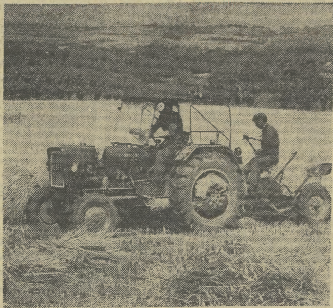
Pogoda nareczcie sprzyja inżynierom.

Ekipy jasielskiego Przedsiębiorstwa Budowlanego inwestycję tę, pochłaniającą ponad 91 mln zł, rozpoczęły realizować we wrześniu 1975 r. zaś rozruch technologiczny podjęto w połowie czerwca br. Gorlicka „fabryka domów” pracującą na trzy zmiany i zatrudniającą niespełna setkę pracowników docelowo wytworząca będzie elementy umożliwiające montaż dwu i dwustu izb rocznie. Te zdolności produkcyjne poligonowa wytwórnia elementów wielkopłytych osiągnie w roku przyszłym. W tym roku natomiast dzieło podjęcia produkcji w tej wytwórni, Gorlicom przybędą cztery nowe bloki mieszkalniowe o 960 izbach. Staną one w nowym osiedlu „Młodych”. (s5)