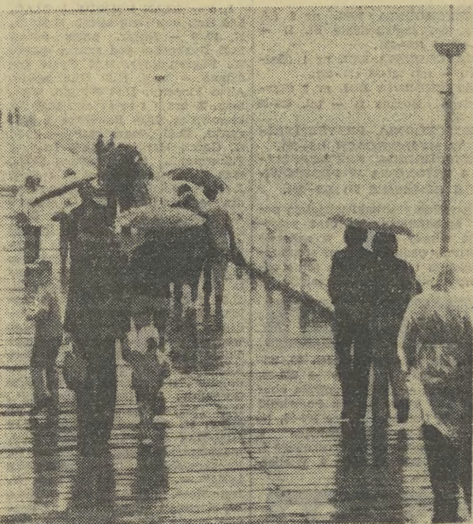
U nas lipcowe słońce, ale nad morzem nadal deszczowo. Na spacerach obowiązują kurtki, sukienki i parasole.

stracji została wezwana policja, która rozprężyła zgromadzony tłum. Jednakże na tym nie zakończyła się akcja kierownictwa zakładów. Po odjeździe policji, do robotników oddano zniszczące strzały. 8 osób zostało rannych, w tym trzy b. ciężko. Okazało się, że strzelali członkowie tzw. ochrony fabrycznej, należącej do specjalnego prywatnego biura ochrony zakładów przemysłowych. Do biura tego wcielili się dwaj policjanci, którzy za odpowiednią zapłatą są gotowi wykonać każde polecenie. Po rajdzie kierownictwa kompanii „Robin Hood” oświadczyli cywnie, że członkowie ochrony „tylko wypełniali swoje obowiązki w obronie własności fabrycznej”. W związku z wypadkami w Montrealu, Konfederacja Narodowych Związków Zawodowych Kanady zażądała od rządu nieważności przeprowadzenia śledztwa i ukarania winnych.