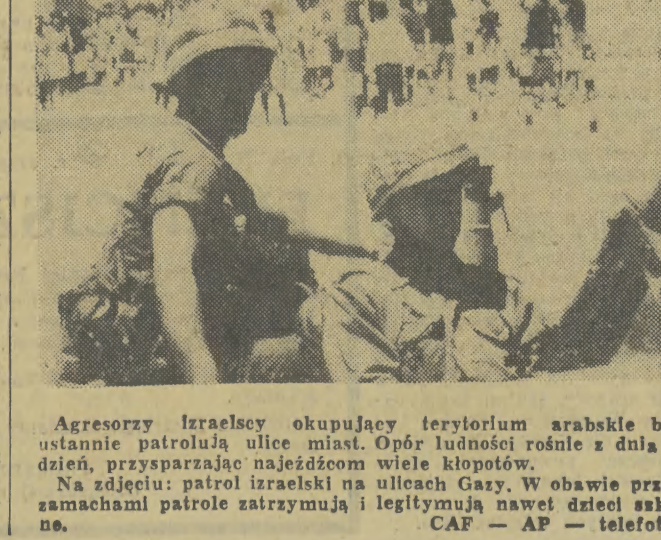
Agresorzy Izraelscy okupujący terytorium arabskie bezustannie patrolują ulice miast. Opór ludności rośnie z dnia na dzień, przysparzając najeźdźcom wiele kłopotów.