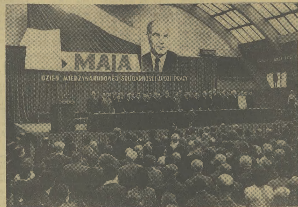
Ogólny widok hali „Wistyl”, gdzie odbyła się wojewódzka Akademia 1-majowa.

(Inf. wł.) W dniu wczorajszym przybrała szczególny odświętny wygląd, ozdobiona biało-czerwonymi i czerwonymi transparentami. Stawili się