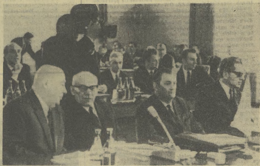
N/z: delegacja Polski podczas obrad. Od lewej — J. Cyrankiewicz, Wł. Gomułka, B. Jaszczuk i J. Kulesza.

Dzisiaj — na 38 dni przed wyborami przesłane zostaną wszystkie spisy wyborców przewodniczącym obwodowych komisji wyborczych. Również dzisiaj — jak już podawaliśmy — odbędzie się Plenum wojewódzkich instancji ZMS, ZMW, ZHP i ZSP, na którym przyjęty zostanie program udziału młodzieży w kampanii wyborczej i w obchodach 25-lecia Polski Ludowej. Komisje organizacyjne powiatowych komitetów FJN do 25 bm. przesyła WK FJN szczegółowe terminarz proponowanych spotkań z kandydatami na posłów i radnych wszystkich stopni. Spotkania te rozpoczyna się 3 maja. Natomiast w nadchodzącą sobotę Wojewódzki Komitet Frontu Jedności Narodu zatwierdzi program wyborczy dla województwa krakowskiego. (2)