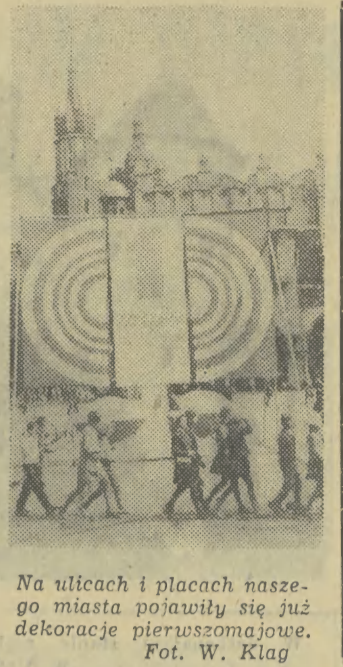
Na ulicach i placach naszego miasta pojawiły się już dekoracje pierwszomajowe.

WAWEL (9-14.15). SUKIENNICZE (zamkn.). DOM SZOLAY-SKICH (pl. Szczep. 2); pol. mal. i rzeźba od 1764 r. (10-15). DOM MATEJKI (Floriańska 41); Poczet królów polskich (10-15). NOWY GMACH (al. 3 Maja 1); (10-15).