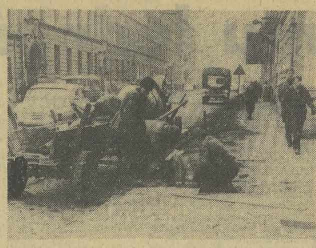
Na wielu ulicach naszego miasta przystąpiono do przeprowadzenia wymiany starych płyt chodnikowych na nowe.