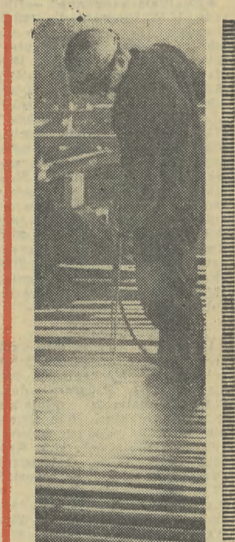
To załoga tego zakładu zainicjowała podejmowanie zobowiązań produkcyjnych dla uczczenia 25-lecia PRL. Oczwicieli mowa o hucie stali szlacheckich „Warszawa”. Na zdjęciu: przygotowywanie kęsów do walcowania.

Agencja France Presse pisze: Według brytyjskiej agencji Press Association, która powołuje się na źródła poinformowane, gen. de Gaulle w rozmowie z ambasadorem brytyjskim w Paryżu C. Soamesem w dniu 4 lutego zaproponował, by stworzyć wielkie europejskie stowarzyszenie gospodarcze wraz z mniejszą liczebnie radą do spraw politycznych. W tej radzie zasiadłoby przedstawiciel Francji, NRF, W. Brytanii i Włoch.