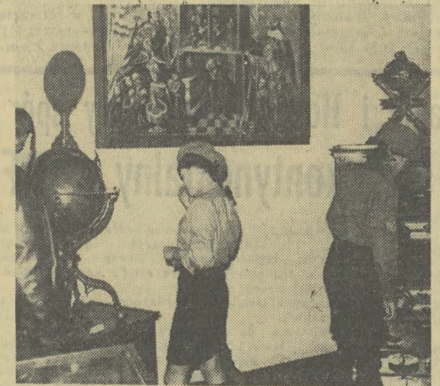
Harcerki i harcerze oglądają pamiętki po Koperniku, zgromadzone w uniwersyteckim muzeum.

Po złożeniu kwiatów pod pomnikiem Kopernika przed uniwersytem, nastąpił przemarsz do siedziby PAN, gdzie rozpoczęła się sesja popularnonaukowa. Odczyt pt. „Młodość Mikołaja