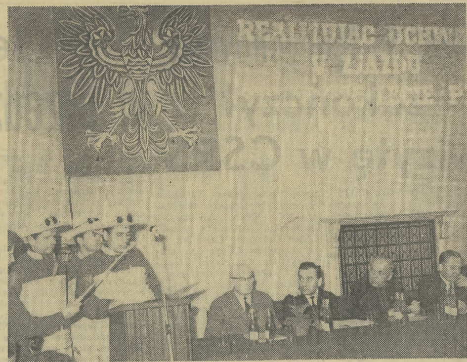
W imieniu załogi tekst podjętych zobowiązań dla uczczenia 25 rocznicy PRL odczytują hutnicy stalowni martenowskiej i konwertorowej Huty im. Lenina.