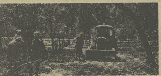
Na spornym odcinku krakowskich Plant rekultywacja dobiega końca.