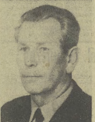
Mieszkańcy, położonej za krakowskimi rogatkami nielewej, Chorzowicy nieraz dawali wyraz społecznej zaangażowaniu. Dzięki ich postawie we wsi wiele się zmieniło. Dzisiaj żyje się tu lepiej, a i po pracy mo-

„LOT”, przed odlotem z Krakowa do Norymbergi. Próba została udaremniona. Sprawca Z. J. został aresztowany.