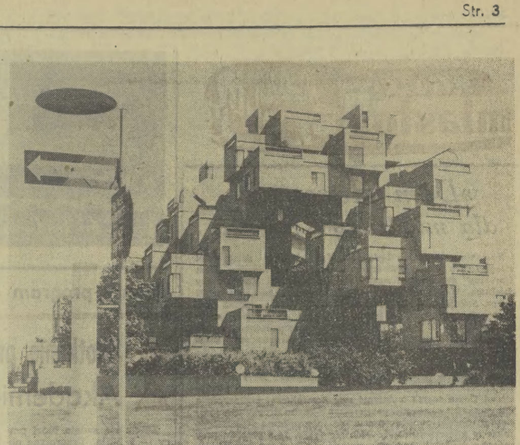
KANADA. Około 30 tysięcy rodzin w Toronto, jednego z największych miast Kanady, zagrożonych jest eksmisją, ponieważ nie są one w stanie zapłacić wysokich i wciąż rosnących czynszów. Tylko w 1975 r. komorne w Toronto zdrożało o 25 proc. Podobna sytuacja istnieje w Montrealu, Ottawie i innych miastach Kanady. Na zdjęciu — jeden z najładniejszych budynków mieszkalnych w Montrealu; za wynajęcie tu chociażby najmniejszego mieszkania trzeba płacić najwyższy w całym kraju czynsz.

Na początku przyszłego roku mamy zamiar zwołać II Ogólnokrajową Konferencję Partii. Podsumuje ona dwuletnie wyniki realizacji uchwał VII Zjazdu i wytyczy nowe zadania w tej dziedzinie. W każdej gminie i mieście, w każdym zakładzie pracy, w każdym województwie zrozbiemy wszystkie, aby przyjąć na II Konferencję z jak największym dorobkiem społeczno-gospodarczym i ideowo-wychowawczym.