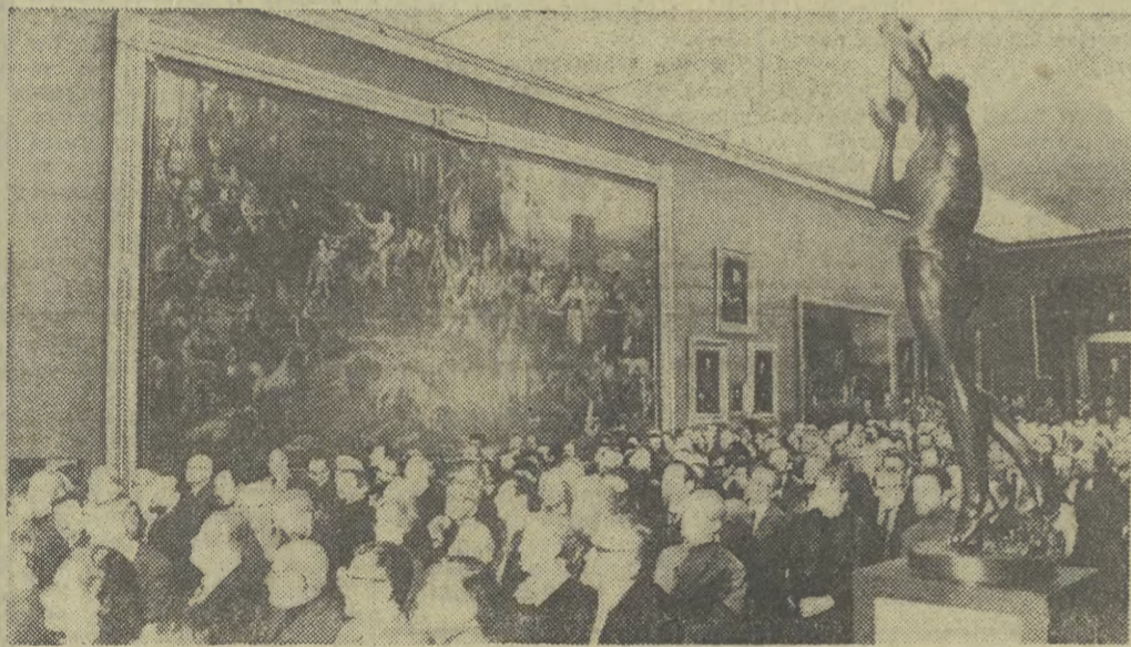
XV Walny Zjazd Związku Polskich Artystów Plastyków rozpoczął obrady

W Ameryce nie brak głosów, iż zakaz rozpowszechniania idei opartych na nienawiści lub wyższości rasowej byłby sprzeczny z „tradycjami wolności słowa”. Dlatego też oczekuje się ostrych kontrowersji w senacie w związku z ratyfikacją paktów praw człowieka.