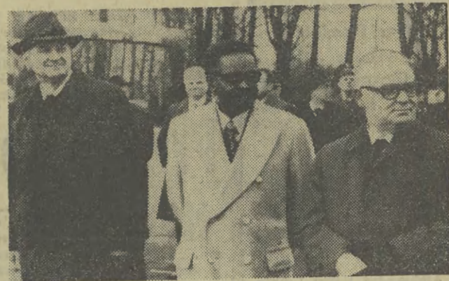
Na warszawskim lotnisku prezydenta powitali członkowie najwyższych władz partyjnych i państwowych z przewodniczącym Rady Państwa Henrykiem Jabłońskim i prezesem Rady Ministrów — Piotrem Jaroszewiczem.

Na zaproszenie przewodniczącego Rady Państwa PRL — Henryka Jabłońskiego, wystosowane w imieniu najwyższych władz partyjnych i państwowych PRL, przybył wczoraj do Polski z oficjalną wizytą przyjaźni, prezydent Ludowej Republiki Angoli i przewodniczący Ludowego Ruchu Wyzwolenia Angoli — Agostinho Neto.