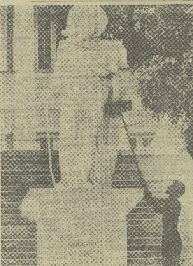
Statua Krzysztofa Kolumba przed siedzibą władz Nassau, głównym miastem wysp Bahama, przypomina, że to tutaj właśnie wyładował w dniu 12 października 1492 r. wielki odkrywca Nowego Świata.

wym. Niektórym aresztowanym udowodniono uczestnictwo w zamachu z bronią w ręku na siedzibę „Banco Central” w Cacerze de Torres w Murcji, jak też oszustwa dokonane w bankach Andaluzji.