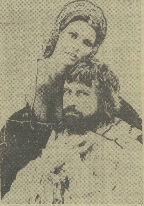
Raquel Welch i Oliver Reed w nowel, kolejnej wersji „Księża i zebra”.