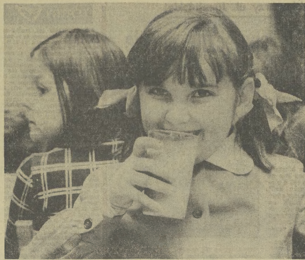
„Szklanka mleka dla każdego ucznia” — Hasło to realizowane jest w szkole nr 143 na Woli w Warszawie już od przeszło 10 lat.

W Kairze zaczyna się dziś wielki maraton konferencyjny, podczas którego poruszone zostaną najważniejsze zagadnienia współpracy politycznej i gospodarczej państw arabskich i czarnej części kontynentu afrykańskiego.