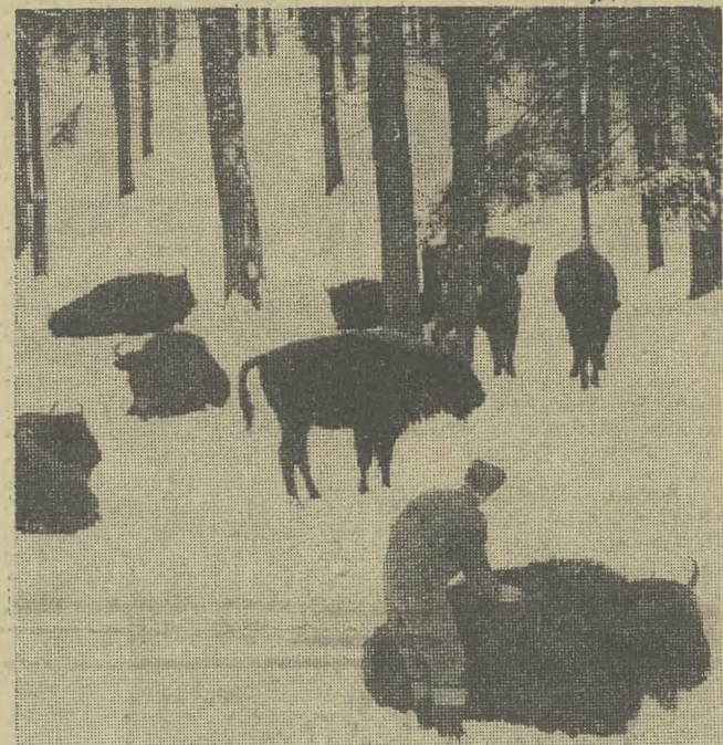
Najsilniejsze są żubry białowiejskie, ale i na innych rezerwach takich terenach żyją u nas żubry rodziny. W Puszczy Boreckiej w woj. suwalskim żyje ponad 40 żubrów. Zimą, jednakowoż dla wszystkich mieszkańców lasu, należy do trudnych okresów. Ludzka pomoc jest więc konieczna...

miały doniesione dokumenty dwustronne i ustalenia podjęte w bezpośrednim dialogu politycznym i sekretarza KC PZPR i prezydenta Republiki Francuskiej. Osiągnięliśmy już — oświadczył mównicą — wysoki poziom współpracy, co wykazuje wynownie, jak można rozwijać taką współpracę w stosunkach między państwami o odmiennych ustrojach społeczno-politycznych na zasadach pokojowego współistnienia. Minister stwierdził, że obec- (DOKOŃCZENIE NA STR. 2)