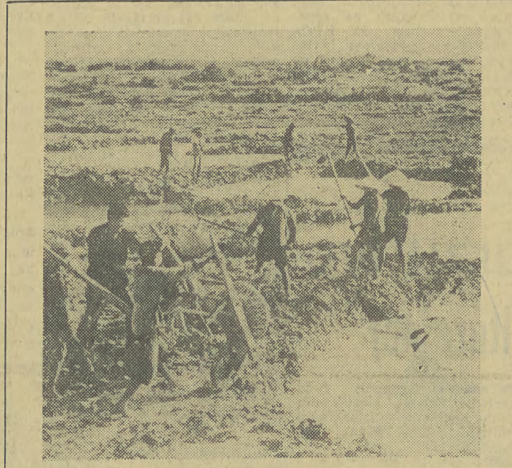
W DEMOKRATYCZNEJ REPUBLICIE WIETNAMU Mieszkańcy wsi wietnamskich na obszarach uprawnych naprawiają zniszczone rowy melioracyjne oraz wyrównują teren, zrzucając bombami amerykańskimi. Na zdjęciu: zasypywanie lejów po bombach w prowincji Vinh Linh.

W związku z występującym niebezpieczeństwem lawin w rejonie Hall Kondratowej, spowodowanym zniszczeniem drzewostanu wiosną 1968 r. ZG PTTK postanawia wyłączyć z eksploatacji schronisko PTTK na Hall Kondratowej począwszy od dnia 1 marca 1969 roku. Ponadto zezwala się w porozumieniu z Oddziałem PIHM i GOPR na okresowe zamykanie schroniska w przypadku występowania pokrywy śnież-