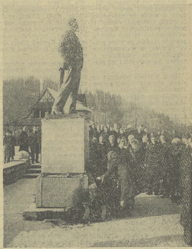
Uczestnicy Pociągu Przyjaźni składają wieńce i wiązańki kwiatów pod pomnikiem W. I. Lenina w Poroninie.