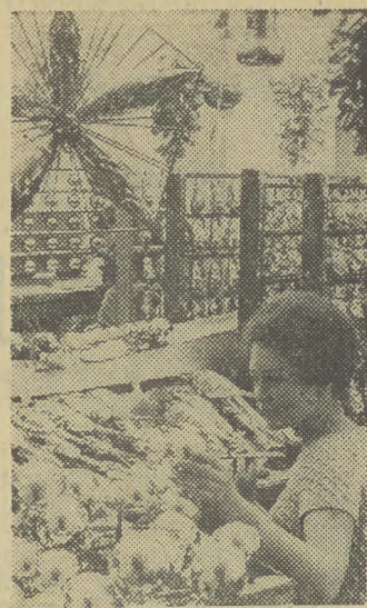
ZBLIŻAJĄ SIĘ ŚWIĘTA

znalazło wyraz w czynach produkcyjnych na czesć Zjazdu i w szerokiej dyskusji przedsejmowej. W znacznej mierze tym właśnie zjawiskom zaudziemy lepsze niż w poprzednich latach postępy w realizacji planów rozwoju gospodarczego. Rząd — zapowiedział minister Majewski zamierza w najbliższym okresie podjąć szereg (DOKONCZENIE NA STR. 2)