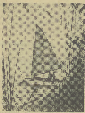
Wskutek silnych mrozów, Jesiora pokryty się lodem. Skonstruowali z tego amatorzy sportu bojerowego i zaczęli intensywne treningi.

W moskiewskich domach towarowych rozpoczął się ruch przedświąteczny. Ururomiono dodatkowe stoiska z upominkami, zabawkami i ozdobami choinkowymi. Przygotowano w tym roku ponad 40 milionów sztuk bombek, gwiazd, tańcuchów i innych rodzajów ozdób choinkowych. W 160 punktach miasta zorganizowana zostanie sprzedaż choinek.