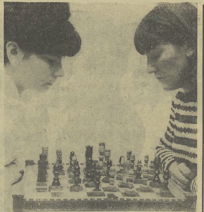
PREZENTY POD CHOINKĘ

Kupujemy dla siebie i dla innych: w nowych, uroczystych strojach uręczymy przyjaciółom upominki (satu)