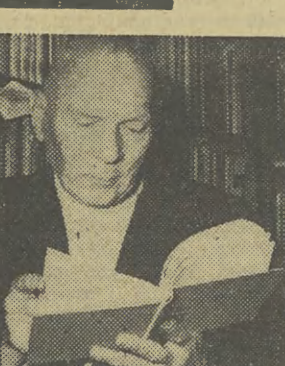
W dniu wczorajszym zmarł w Krakowie po długotrwałej chorobie jeden z najznakomitszych znawców historii literatury polskiej, wieloletni profesor Uniwersytetu Jagiellońskiego, świętny edytor, wychowawca wielu pokoleń polskich polonistów — Stanisław Pi-goń.

lamiach „Gazety Krakowskiej” dawałmy sprawozdanie z najnowszego wydania Stanisława Pi-gonia. Książka spotkała się z obzrymym zainteresowaniem czytelników, a Profesor poświęcił tam mnóstwo ciekawych opisów własnym i mniejszym wydziałom w skali międzywojennego 20-lecia nie wyłączone słynne wizyty profesorów Uniwersytetu w prezydenta Rzeczypospolitej, podczas której wskazywano na złą politykę sanacji... Szkole średnią ukończył Stanisław Pi-goń w Jasle, (DOKOŃCZENIE NA STR. 2)