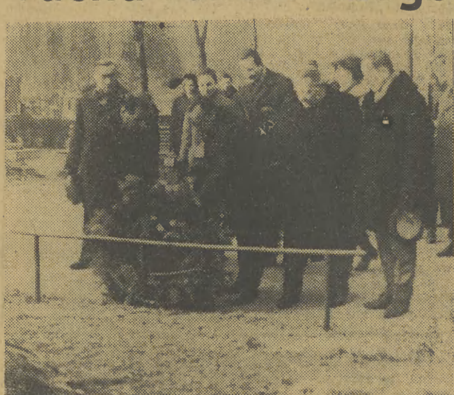
Składanie wieńców w Alei Zasłużonych przez przedstawicieli KW PZPR w Krakowie.

(Inf. wł.) Z okazji 50-tej rocznicy powstania KPP i 20 rocznicy zjednoczenia polskiego ruchu robotniczego na cmentarzu Rakowickim odbyło się uroczyste składanie wieńców. Złożono je na mogiłach działaczy ruchu robotniczego w Alei Zasłużonych, na grobach uczestników powstania krakowskiego w 1923 r. i robotników poległych w walce z sanacją a wśród nich słynnych „sempert-